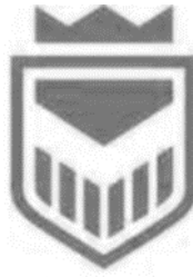
Gambar 1. Keterangan gambar