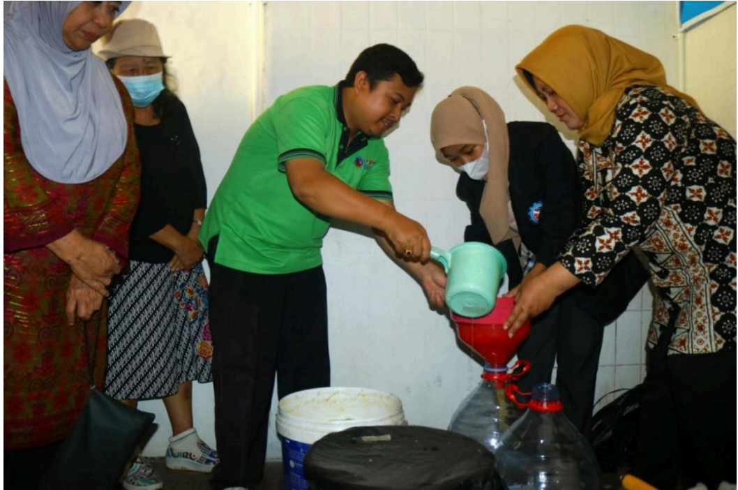
Gambar 3. Pembelajaran Bersama Pembuatan Granul bersama Warga

Pada gambar 3 adalah kegiatan pembuatan granul dari bahan echo enzyme bersama warga, dari tahap ini bahan limbah sampah rumah tangga di olah menjadi pupuk yang bisa di manfaat kan di lingkungan sehingga akan mengurangi limbah di masyarakat. Pada kegiatan ini di lakukan pendampingan untuk membuat granul dari awal pencacahan limbah sampai penyaringan dan menjadi granul setengah jadi.