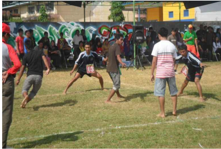
Gambar 1 Perlombaan Permainan Gobak Sodor

format centre, dan diberi jarak 1 spasi dari gambar. Bila lebih dari 1 baris, judul menggunakan spasi tunggal. Contoh penyajian gambar sebagai berikut: