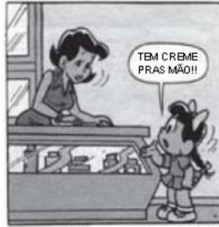
Revista Chico Bento - set 1992

No segundo quadrinho, Chico Bento diz: "Hum... Zé da Roça!" indica