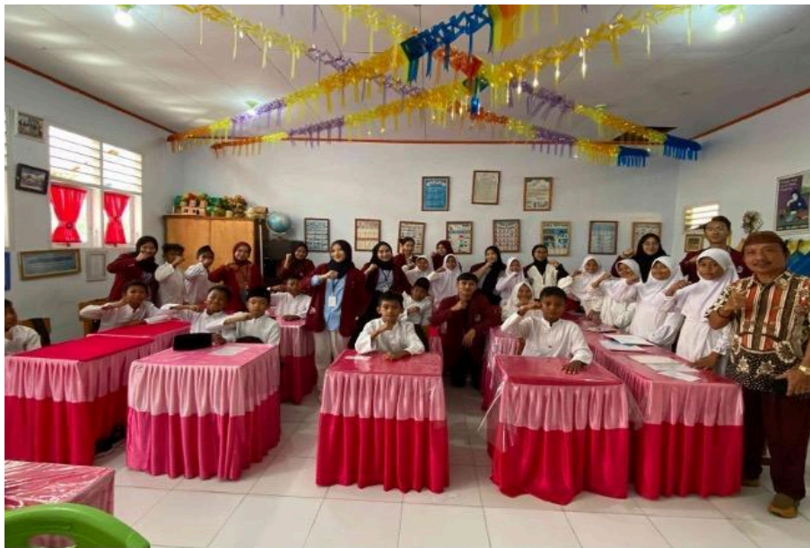
Gambar 1. Sosialisasi PHBS

Terdapat tiga ukuran (lebar) gambar dan grafik yang disarankan, yaitu 8, 12, dan 16 cm. Apabila Penulis memilih menggunakan gambar/grafik berukuran (lebar) 8 cm, maka silahkan diatur agar layout gambar/grafik berformat “square”. Dalam hal ini, penulis perlu menginsert kolom text untuk memberikan keterangan Gambar. Apabila Penulis memilih menggunakan gambar berukuran (lebar) 12 atau 16 cm, maka silahkan diatur agar layout gambar/grafik berformat “in line with text”.