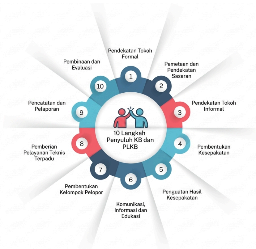
Gambar 2.1. 10 Langkah Penyuluh KB dan PLKB

Pelaksanaan Mekop Linlap menggunakan fungsi manajemen yaitu Perencanaan ( Planning ), Pengorganisasian ( Organizing ), Penggerakan dan Pelaksanaan ( Actuating ), serta Pengendalian dan Evaluasi ( Controlling ) yang dioperasionalkan melalui 10 Langkah Penyuluh KB dan PLKB. Keempat fungsi tersebut merupakan satu siklus manajemen yang dilaksanakan secara berkesinambungan dalam perencanaan tahunan, kemudian dijabarkan ke dalam rencana kerja triwulanan dan bulanan sesuai kondisi wilayah. Pendekatan ini memastikan Penyuluh KB dan PLKB melaksanakan program secara sistematis, mulai dari perencanaan, pelaksanaan, hingga evaluasi dan perbaikan berkelanjutan.