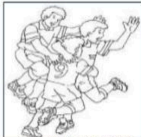
GRUPO DE DEPORTE.