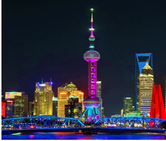
Thượng Hải về đêm