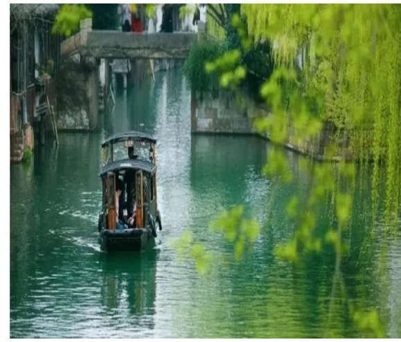
Cảnh sắc Giang Nam