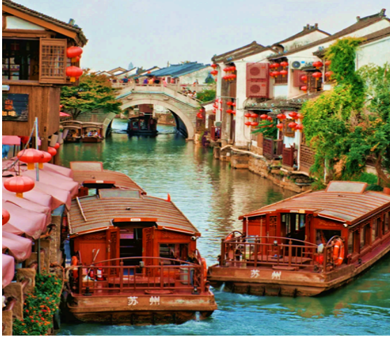
Ô Trấn – “Đệ nhất Trấn Giang nam”