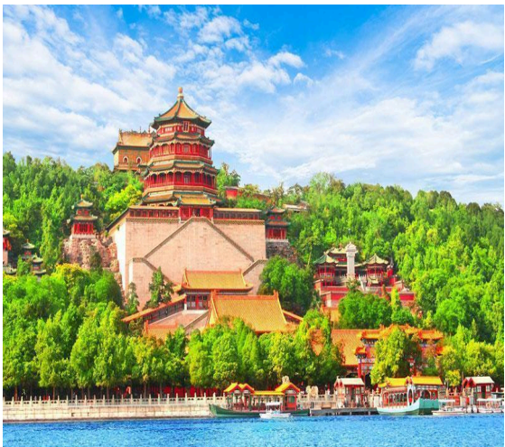
Di Hòa Viên