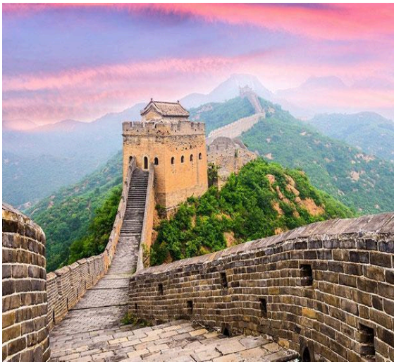
Vạn Lý Trường Thành