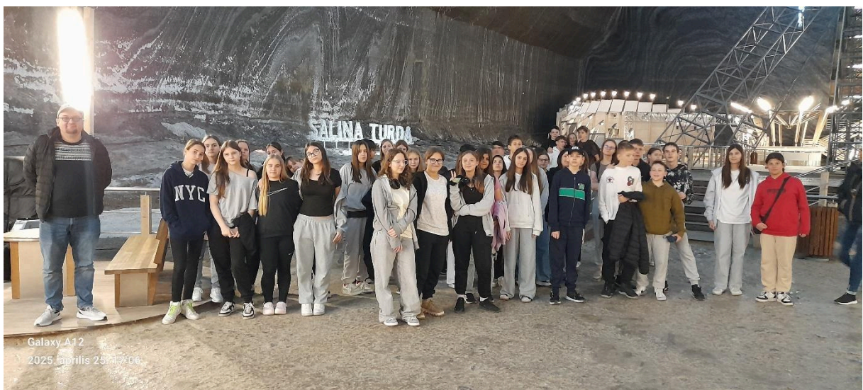
Galaxy A12 2025. április 25. 17:06