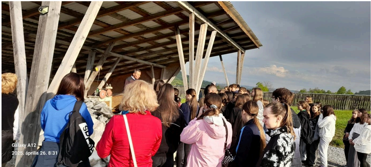
Galaxy A12 2025. április 26. 8:31