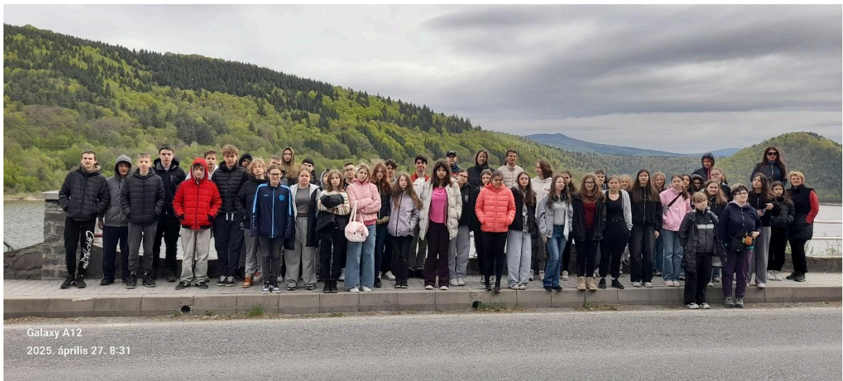
Galaxy A12 2025. április 27. 8:31