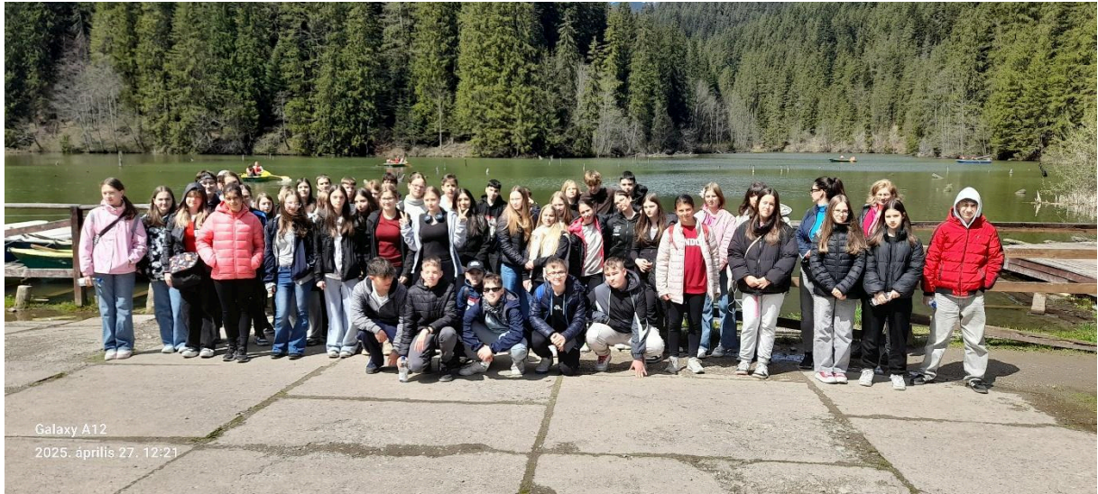
Galaxy A12 2025. április 27. 12:21