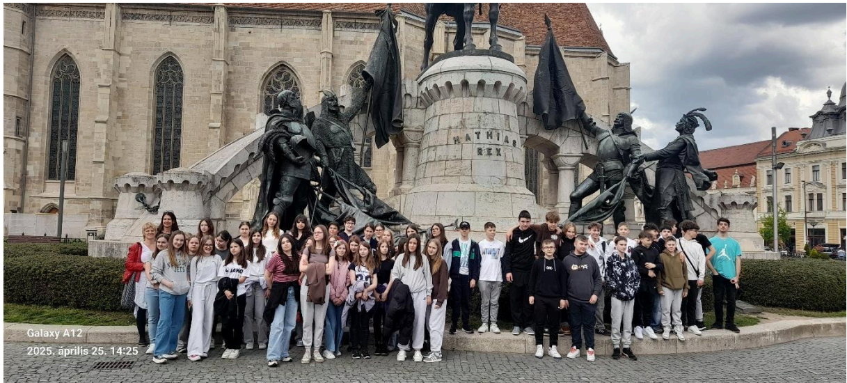
Galaxy A12 2025. április 25. 14:25