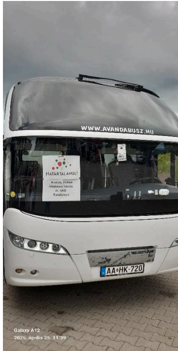
Galaxy A12 2025. április 25. 11:39