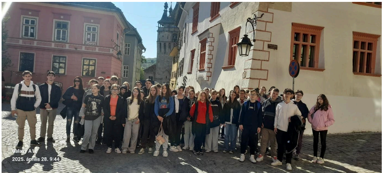
Galaxy A12 2025. április 28. 9:44