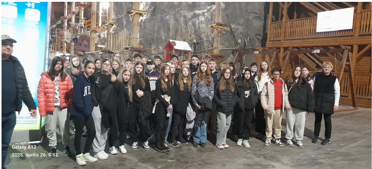
Galaxy A12 2025. április 26. 9:53