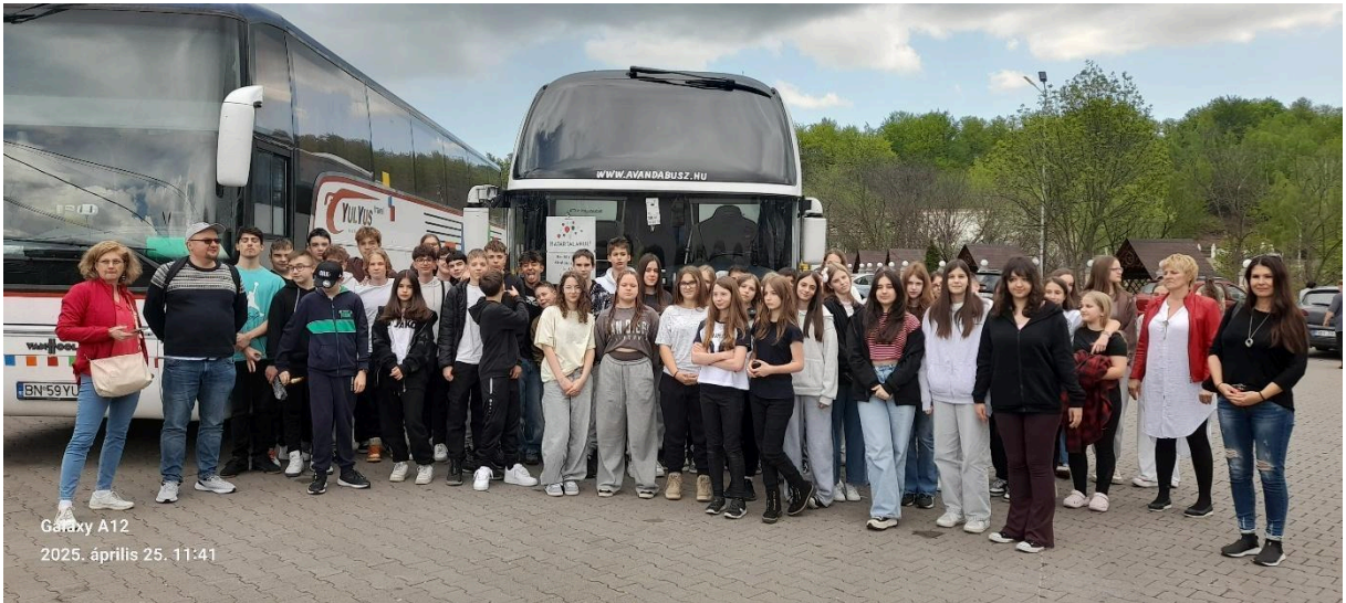
Galaxy A12 2025. április 25. 11:41