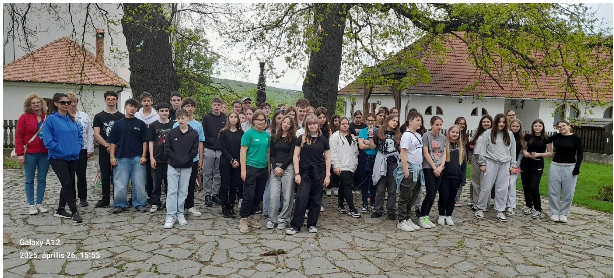
Galaxy A12 2025. április 26. 15:53