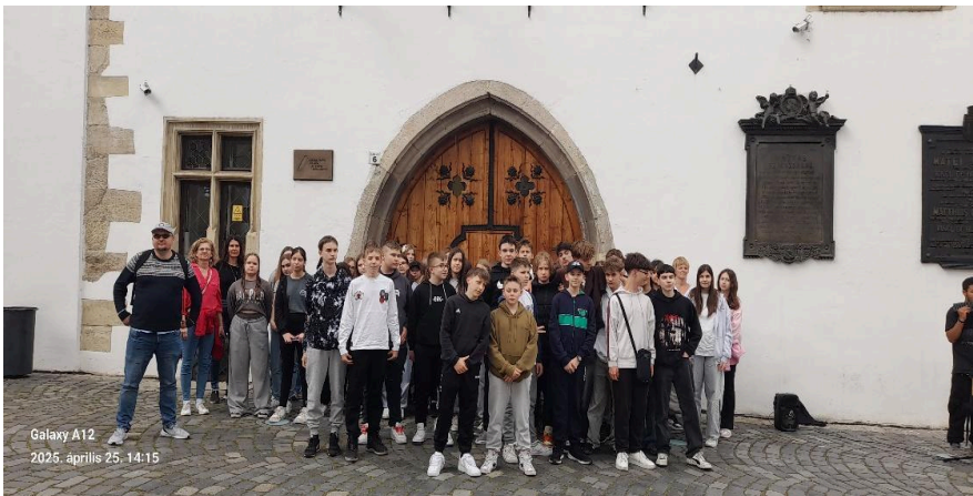
Galaxy A12 2025. április 25. 14:15