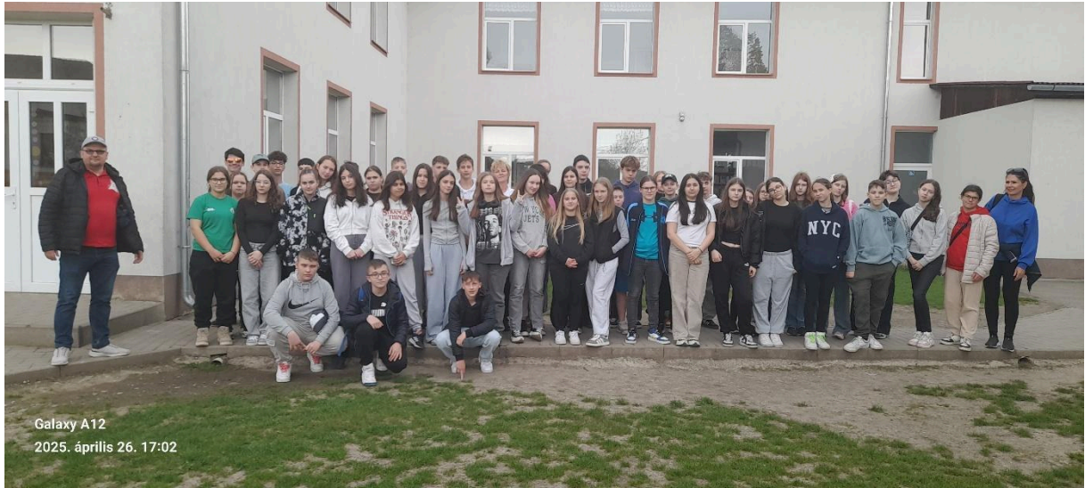
Galaxy A12 2025. április 26. 17:02