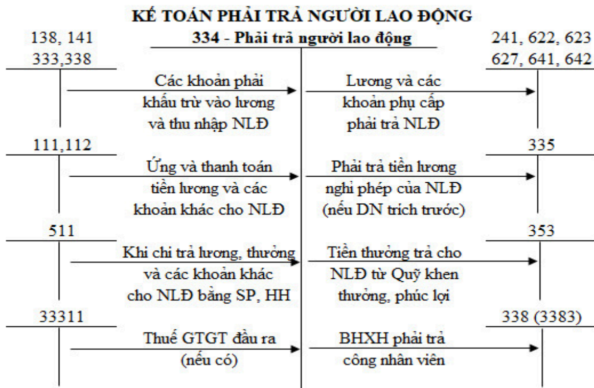
Sơ đồ 1.1: Kết cấu tài khoản 334