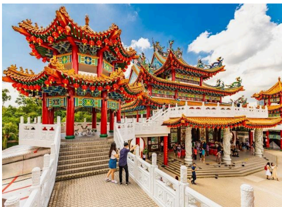
เจียงใต้

วัด Thean Hou เป็นวัดหยกชั้นของเทพริดาแห่งท้องทะเล Mazu ของจีน ตั้งอยู่ในกรุงกัวลาลัมเปอร์ ประเทศ มาเลเซีย ตั้งอยู่บนพื้นที่ 1.67 เอเคอร์ (6,758 ตร.ม.) บน ยอดที่ดิน Robson Heights บน Lorong Bellamy มอง เห็น Jalan Syed Putra สร้างเสร็จในปี 1987 และเปิด อย่างเป็นทางการในปี 1989 วัดแห่งนี้สร้างขึ้นโดยชาว ไหหลำที่อาศัยอยู่ในมาเลเซีย และทรัพย์สินเป็นของและ ดำเนินการโดย สมาคมไห่หนานเขตสลังจอร์และ สหพันธรัฐ เป็นหนึ่งในวัดที่ใหญ่ที่สุดในเอเชียตะวันออกเฉียงใต้