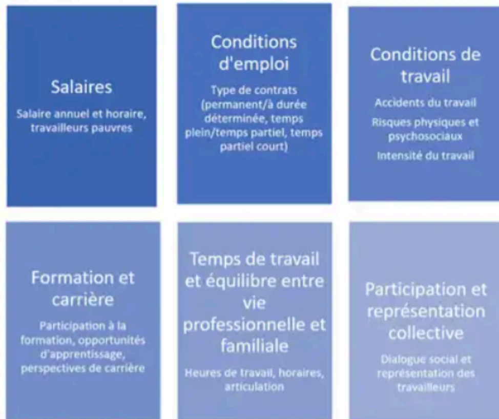
Figure 1 : Dimensions de la qualité de l'emploi et du travail