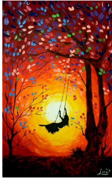
FIGURA COMPLEJA – FONDO SIMPLE

¿Y si intentamos otras al revés Figuras complejas y Fondos simples?