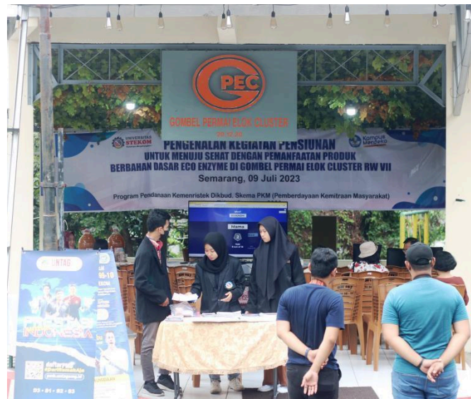
Gambar 1. Penyuluhan tentang manfaat Produk Eco