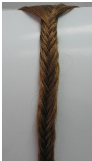
2. Коса риб'ячий хвіст