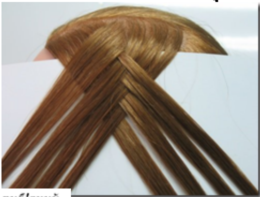
Плетіння коси риб'ячий

Плетуть як звичайну трипрядну косу, проте пасма формуються особливим способом. Волосся розподіляють на дві великі частини (два пасма). Третє тоненьке пасмо відділяють почергово від кожного великого пасма і перекладають почергово вліве, а потім вправо пасмо.