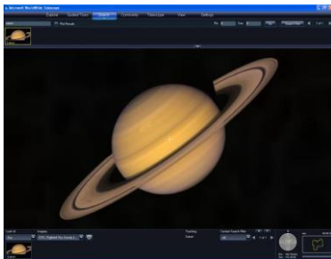
Gambar 1 Worldwide Telescope

Gambar dan tabel harus diletakkan sedekat mungkin dengan teks yang berhubungan. Hindari penggunaan gambar dan tabel berwarna, karena jurnal akan dicetak hitam-putih. File gambar harus disertakan dalam format .gif, .jpg, .bmp, .png, .psd, atau .ai. Semua gambar dan tabel harus disertai keterangan dan nomor gambar atau tabel.