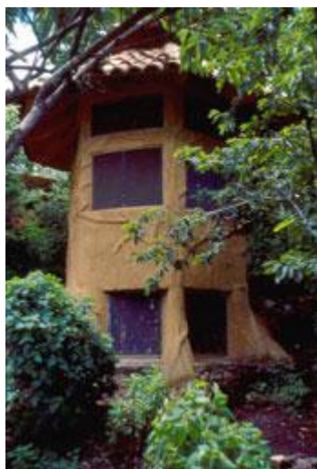
Sanitario ecológico seco en la Ecoaldea Huehucoyotl, Edo. de Morelos, México

Algo queda deshidratado si se elimina toda el agua que contenga. En un sanitario seco se deshidrata el contenido que cae en la cámara de tratamiento; esto se logra con calor, ventilación y el agregado de material secante. Hay que reducir la humedad del contenido a menos de 25% tan pronto como sea posible, ya que con este nivel se acelera la eliminación de patógenos, no hay malos olores ni producción de moscas. El uso de una taza de sanitario diseñada especialmente, que desvie la orina y la almacene en un recipiente aparte, facilita la deshidratación de las heces. La orina contiene la mayor parte de nutrientes y generalmente está libre de patógenos, por lo que puede utilizarse directamente como fertilizante, es decir, sin más procesamiento. En general, resulta más difícil deshidratar excremento mezclado con orina, aunque en climas extremadamente secos la deshidratación se facilita