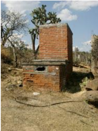
Triste ejemplo de un clivus multrum mal construido (y nunca utilizado) durante una campaña masiva de implementación de "sanitarios ecológicos" en comunidades rurales en Michoacán

Es detalloso, construirlo bien, es más delicado de lo que generalmente se dice en los manuales. Debes seguir los planos adecuados (el croquis arriba es un esquema, de ninguna manera es un plan detallado a seguir), con las pendientes correctas y una cuidadosa colocación de los tubos de aireación y ventilación. Recomiendo tubos GRANDES de ventilación (min 6 pulgadas de diámetro) que salgan sin codos ni desviaciones, directamente hasta 1 m arriba del techo de la casa .