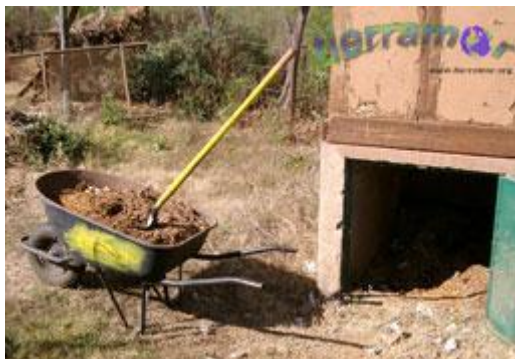
cosecha de composta del sanitario compostero- después de un descanso de 6 meses, esta no presenta ningún tipo de olor desagradable, y se puede poner como abono a los árboles frutales (ver abajo) .