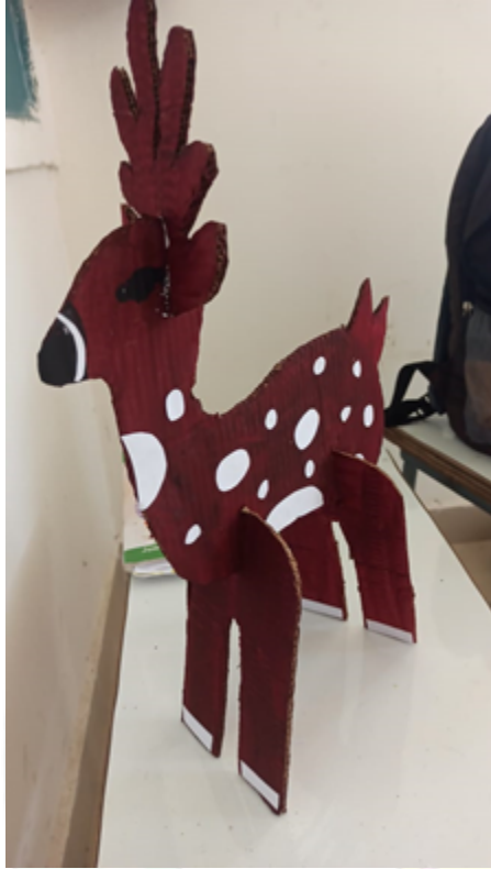
Example of question 4

Make a cardboard Animal according to your choice ?