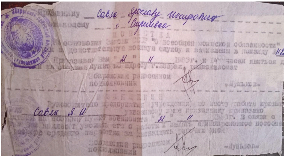
Світлини колишнього солдата Сав'яка Я.Й. і його повістка, 1983 рік