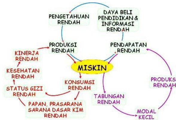
Gambar 2. Lingkaran Kemiskinan

Judul Gambar diberi nomor dan ditulis di bagian bawah gambar dengan format huruf bold dan rata tengah (center) dengan disertai sumber (jika ada). (font size 10, jenis font Cambria, Justify)