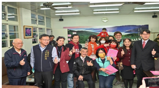
圖11、參加幸福駐點教室揭牌部分嘉賓