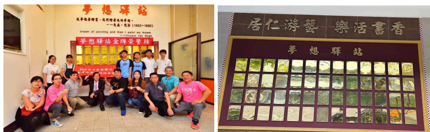
圖09與10、勇敢追夢--夢想驛站

鼓勵同學們，走出居仁，走出臺中市，向全國、向全世界挑戰！能夠列名全國前三名以上或全世界佳作以上。學校會特別訂製金牌，鑲嵌在夢想廣場的夢想驛站榮譽牆上(如圖09、圖10)，並邀請當事人與其監護人及指導老師一起出席揭牌，共享榮耀！