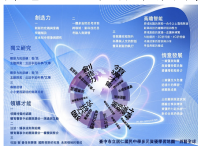
圖06、資優教育課程地圖