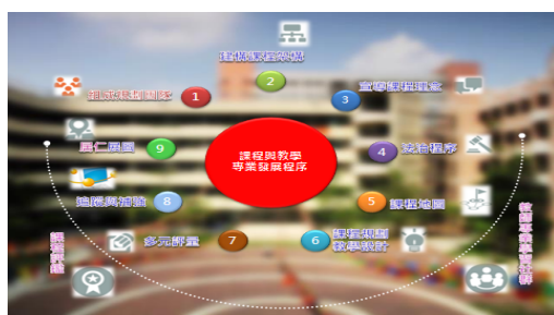
圖01、教師專業發展流程結構圖

至於，教師專業發展流程的11個焦點，其每一階段的专业成長重點，以表01呈現如下：