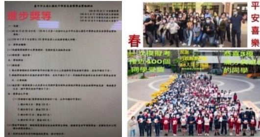
圖02家長會進步獎學金實施辦法 圖03、進步獎實際頒獎盛況

因此，我們學校跟愛孩子們的家長會，研訂了讓每一個孩子都可以挑戰自己、可以跟自己比的進步成長機制：跟自己比，即使進步一分、進步一點點，也是值得我們鼓勵的。如圖02獎學金實施辦法與圖03頒獎盛況，如下：