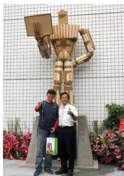
圖05、林晉毅創作的「機器人讀書」公共藝術