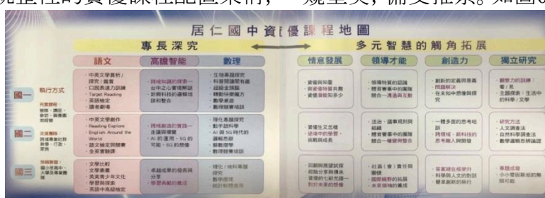
圖08、資優教育課程配置架構

咱們居仁國中擁有超過46年龍頭資優的師資團隊、課程及教學實力堅不可摧、與獨步中台灣資優教育課程與教學的創造及執行實力，這可從擁有設計連貫性、系統性、與統整性的資優課程配置架構，一窺堂奧，備受推崇。如圖08