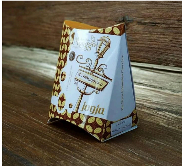
Dummy desain kemasan