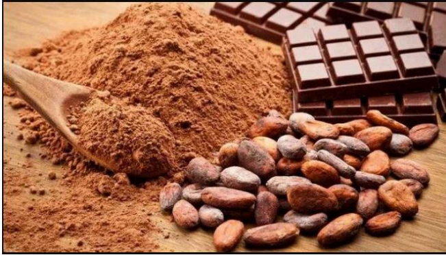
Foto produk makanan