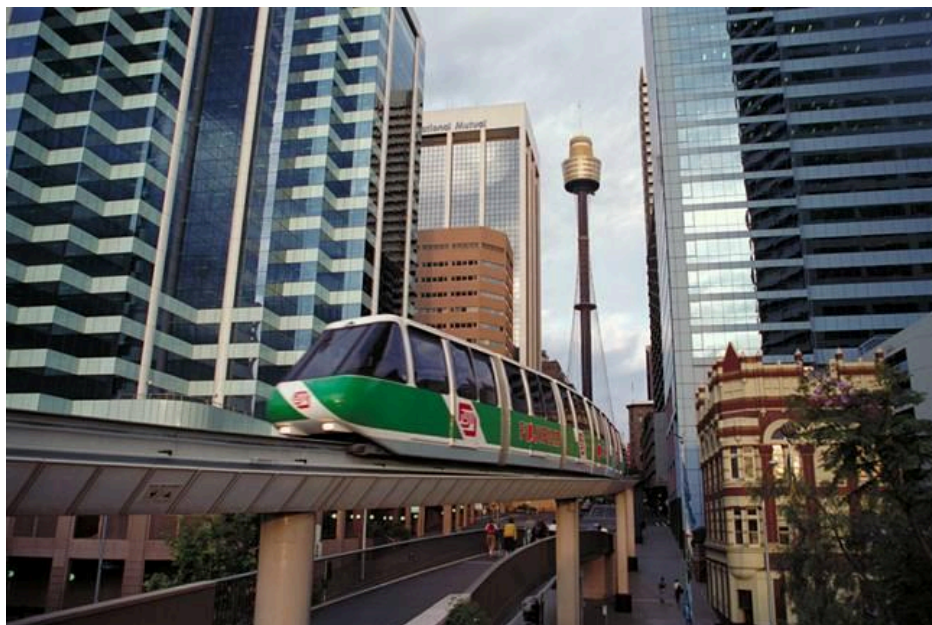
Урбаністичний пейзаж Сіднея

Крім показника людності та значної густоти населення для міста характерна зайнятість населення не в сільському господарстві, специфічна компактна забудова та високий рівень благоустрою. В Японії вважають містом населений пункт з людністю понад 50 тис.осіб, в Нідерландах – 20 тис.осіб, в Україні та Росії – 12 тис.осіб, у США – 2,5 тис.осіб, в Ісландії – усього 200 осіб. За статистикою ООН – 20 тис.осіб.