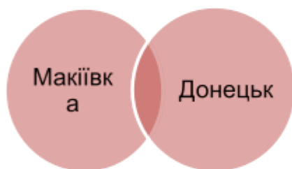
Мал. № 2