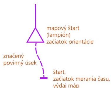
povinný úsek na mapový štart vyznačený na mape