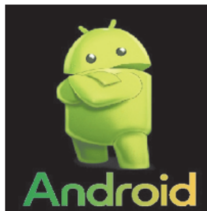
Мал. 1. Зразок зображення логотипа ОС Android

Останній файл з іменем f01 не повинен містити жодної літери з назви ОС.