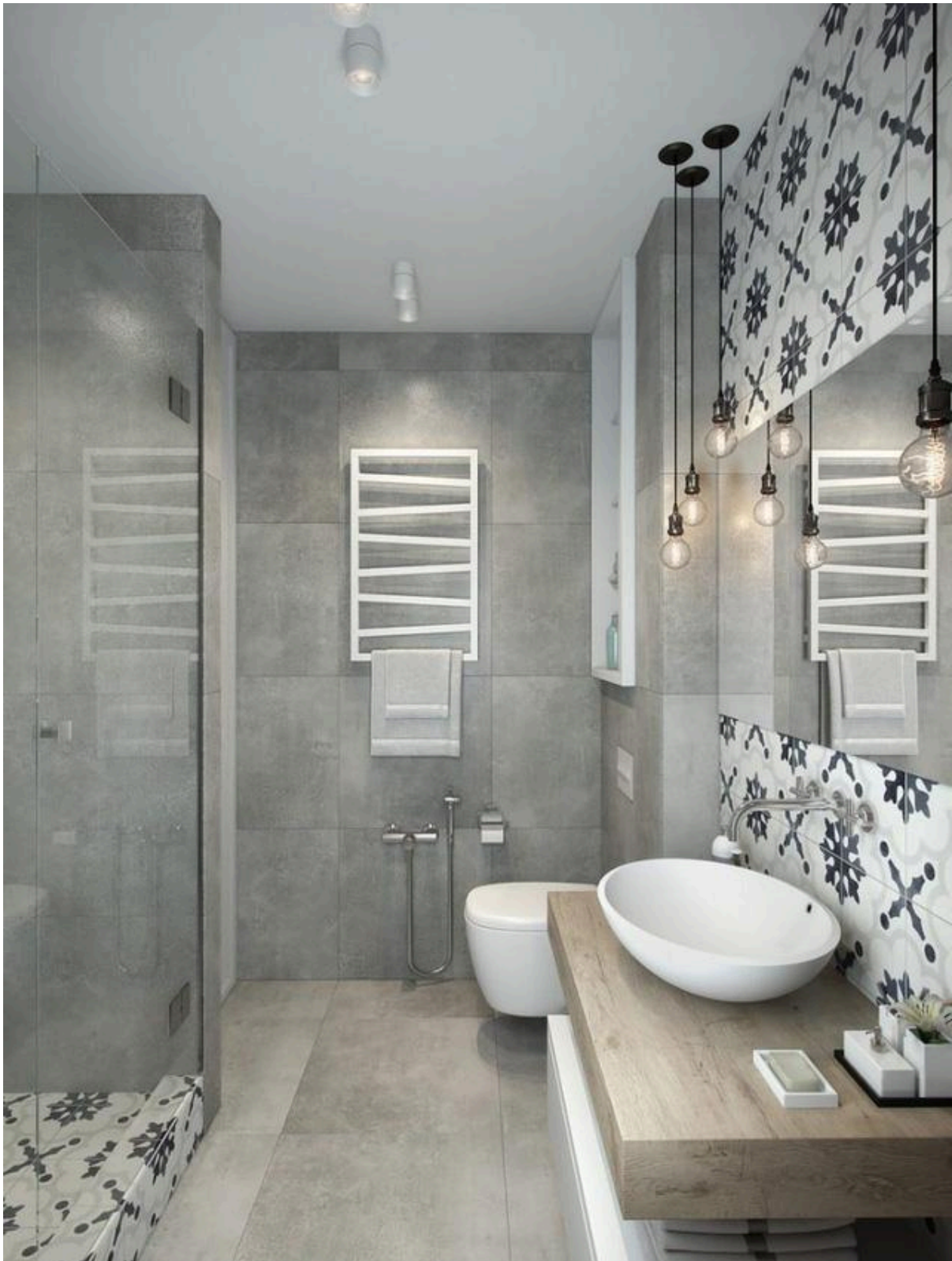
Nhà vệ sinh[/caption]

[caption id="attachment_14630" align="aligncenter" width="640"]