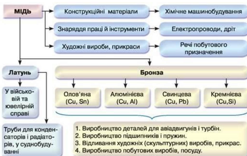
Рис. 50. Схема застосування міді та її сплавів

Мідь та її сплави. Дізнайтеся про застосування міді та її сплавів, опрацювавши рис. 50.