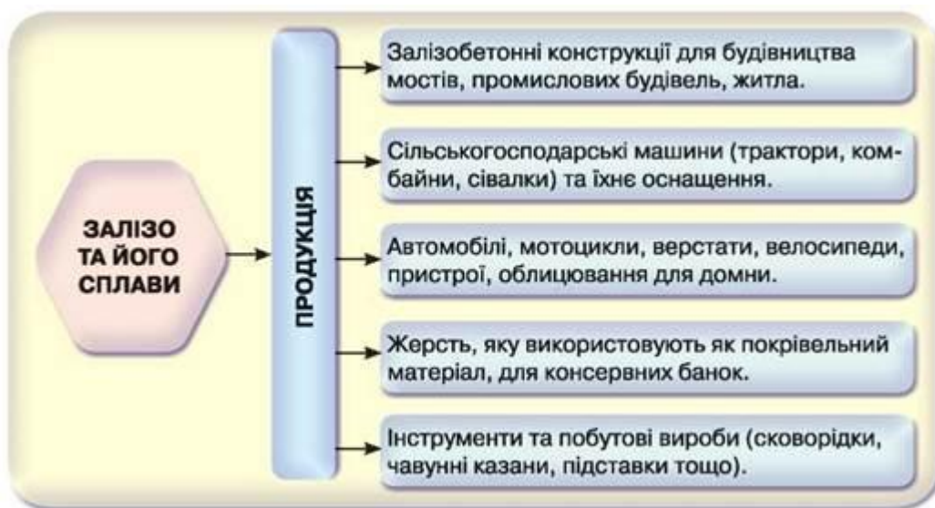
Рис. 51. Схема застосування заліза та його сплавів

Сталь – сплав, у якому значно менший вміст Карбону (0,1-2 %) і домішок мангану, сполук Силіцію, Фосфору та Сульфур. Менший вміст Карбону надає сталі більшої ковкості та пластичності. Тому її можна штампувати, прокатувати, кувати. Для поліпшення цих якостей сталь загартовують, тобто розжарену сталь швидко охолоджують. Гартована сталь значно твердіша. Водночас сталь з низьким вмістом Карбону загартовуванню не піддають. Для надання сталі певних якостей її легують, тобто додають до неї інші метали. Легувальними металами найчастіше є хром, вольфрам, нікель, ванадій, манган, молібден, меншою мірою – титан, кобальт, берилій. А з неметалів – силіцій. Застосування заліза та його сплавів подано в схемі на рис. 51.