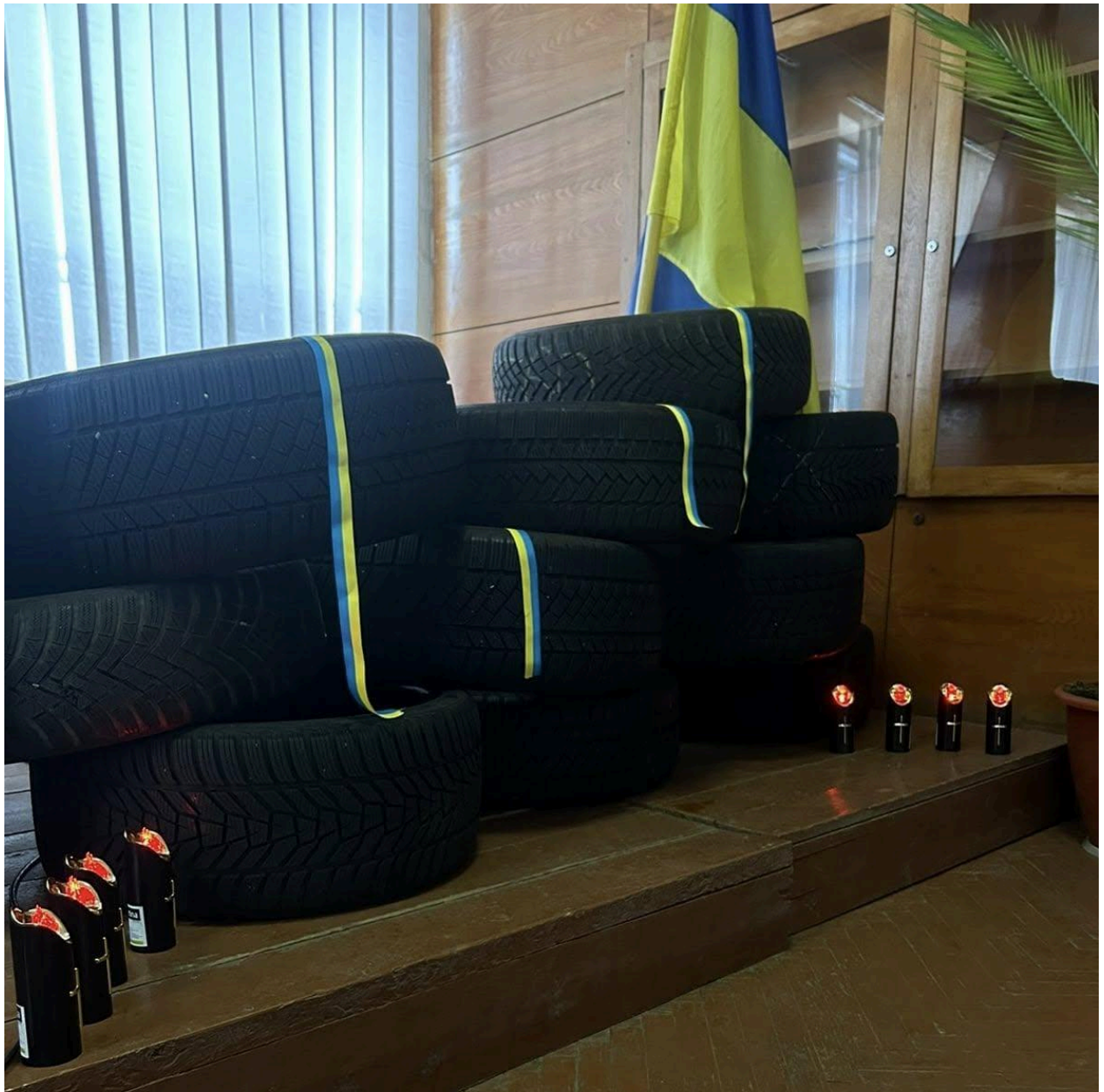
День гідності та свободи