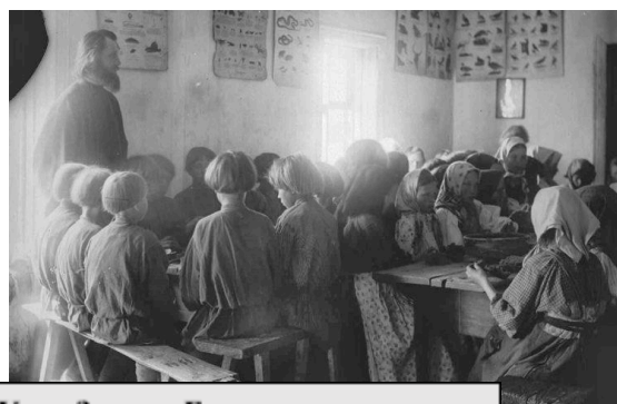
Урок Закона Божьего в церковно-приходской школе XIX в.

Просветительская деятельность Софийского православного братства заключалась в его опеке образования. В сентябре 1882 г. было открыто Братское начальное одноклассное училище, в которое ежегодно зачислялось по 50 учащихся. 8 ноября 1892 г. открылась Гродненская женская воскресная школа. В сентябре 1889 г. состоялась торжественная закладка церковно-приходской школы Софийского братства имени графа М. Муравьева. 26 сентября 1900 г. в здании также находилась воскресная школа, читальня с книжным складом и библиотека [3; с. 17]. После того, как в сентябре 1901 г. Гродненский