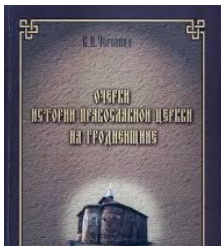
«Очерки истории Православной Церкви на Гродненщине»

Еще одним ценным источником информации данного ученого являются «Очерки истории Православной Церкви на Гродненщине: с древнейших времен до наших дней». Монография. Часть 2. 2005 г. Данная книга является продолжением одноименной монографии, вышедшей в свет в 2000 г. Она состоит из серии очерков, посвященных истории Православия в Принеманском крае кон. XIX – сер. XX в. В ней