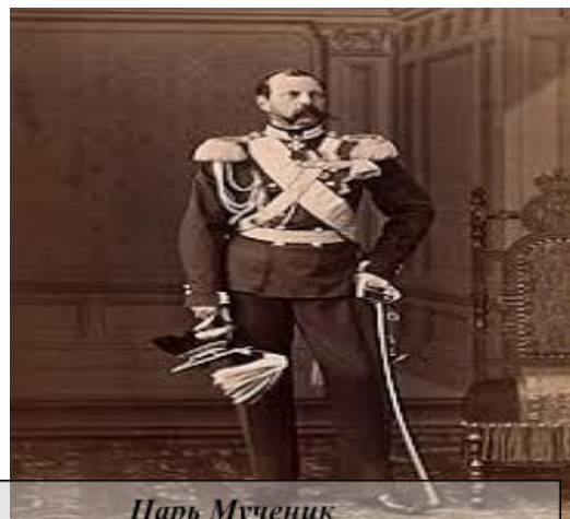
Царь Мученик Император Александр II

На территории Гродненской губернии во второй половине XIX в. действовали несколько братств. Одним из более многочисленных и деятельных стало Гродненское Софийское православное братство (1882 –1915 гг.). Импульсом к возникновению братства стало убийство императора Александра II в марте 1881 года, на жизнь которого террористы-народовольцы покушались с поистине маниакальной одержимостью. Сомнительная слава цареубийце принадлежала уроженцу Гродненской губернии И. Гриневицкому, что еще более усугубило скорбь гродненцев по поводу гибели царя.