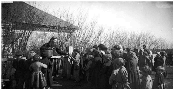
Миссионерская деятельность православных братств XIX в

Благотворительная деятельность Гродненского Софийского братства способствовала формированию православной общины как сообщества, которое