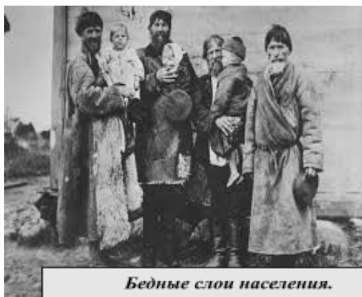
Бедные слои населения. Россия XIX в

Гродненское Софийское православное братство (1882-1915 гг.) выступало той организацией, которая объединяла верующих людей вокруг общих ценностей и целей. Братство активно занималось благотворительной деятельностью, помогая больным, сиротам и бедным. Оно оказывало