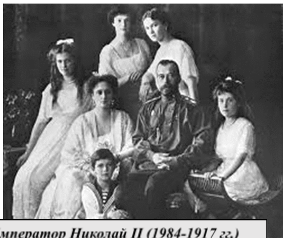
Император Николай II (1868-1918 гг.) с семьей