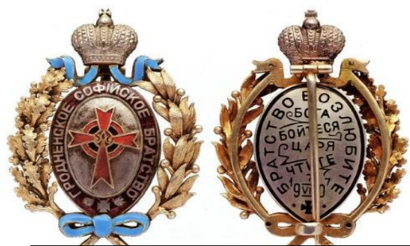
Нагрудный знак Гродненского Софийского православного братства

Особый интерес представляет атрибутика членов Софийского православного братства. Исходя из Устава одним из основных символов братства являлась Икона Христа Спасителя, сооруженная в память освобождения крестьян, исполнителями ВЫСОЧАЙШЕГО указа освободителя от 1 марта 1863 года, хранившаяся при Гродненском Софийском соборе. Братство имело две хоругви: на одной из них – священные изображения Софии Премудрости Божией и Св. Благоверного Князя Александра Невского, на другой – Успение Пресвятой Богородицы и Коложанской Иконы Божией Матери [9; с. 342].