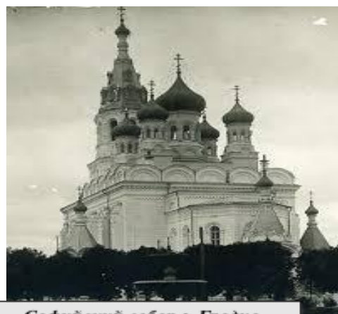
Софийский собор г. Гродно XIX в.

материальную и моральную помощь своим членам и всем нуждающимся. Так как одной из важнейших задач своей деятельности