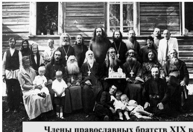
Члены православных братств XIX в.

Гродненское Софийское братство было не только религиозной организацией, но и центром культурной жизни, где собирались люди для обсуждения важных вопросов, проведения образовательных мероприятий и благотворительных акций. Члены братства