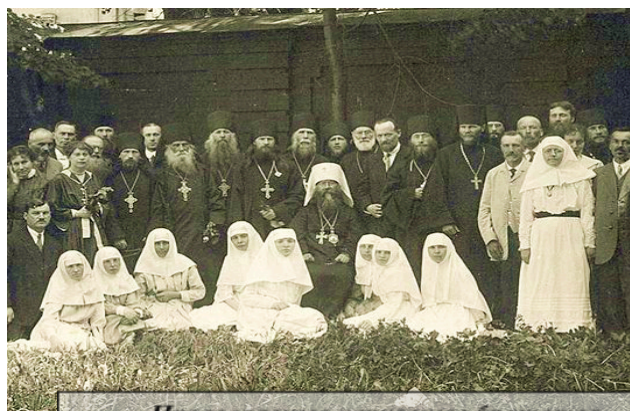
Православные церковные братства XIX в.

Братство. Сколько глубокого смысла вложено в это слово! Братство-это братское родство, братский союз, содружество. Стремление ценить родство характерно для многих поколений нашего православного народа. Не зря говорят: «Братская любовь лучше каменных стен», «братская трапеза», «братское добро», «делиться по-братски».