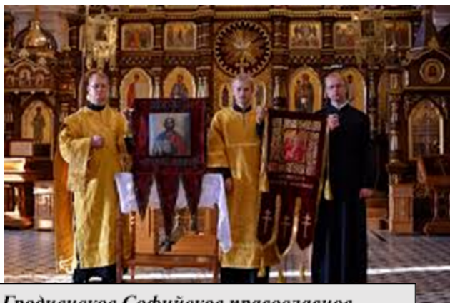
Гродненское Софийское православное братство. Наши дни.

В результате проведенного исследования по теме «Гродненское Софийское православное братство на территории Беларуси конца XIX – начала XX века: его история, роль и влияние на социокультурную жизнь региона» было выявлено, что данная организация играла значительную роль в религиозной и культурной жизни Гродно в XIX – нач. XX вв. Подробно была изучена история братства, его деятельность, влияние и роль на белорусских землях. Основные