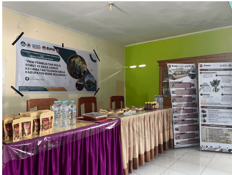
Gambar 1. Pelaksanaan Pengabdian (ukuran keterangan gambar 9pt)

Gambar yang dicantumkan pada naskah harus dengan kualitas yang baik. Gambar tidak berdiri sendiri dan harus merupakan bagian yang relevan dari naskah. Agar diperhatikan bahwa gambar bukan merupakan dokumentasi yang tidak terkait dengan pembahasan naskah. Pastikan naskah tidak menampilkan gambar yang menunjukkan identitas maupun afiliasi para penulis. Jurnal versi cetak dicetak dengan warna hitam putih, penulis sebaiknya menyesuaikan gambar dengan kondisi tersebut. Contoh peletakan serta penamaan gambar seperti pada Gambar 1 dan contoh menampilkan diagram pada Gambar 2