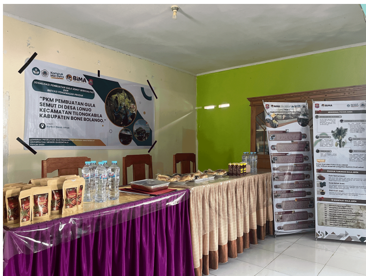
Gambar 1. Pelaksanaan Pengabdian (ukuran keterangan gambar 9pt)

Gambar yang dicantumkan pada naskah harus dengan kualitas yang baik. Gambar tidak berdiri sendiri dan harus merupakan bagian yang relevan dari naskah. Agar diperhatikan bahwa gambar bukan merupakan dokumentasi yang tidak terkait dengan pembahasan naskah. Pastikan naskah tidak menampilkan gambar yang menunjukkan identitas maupun afiliasi para penulis. Jurnal versi cetak dicetak dengan warna hitam putih, penulis sebaiknya menyesuaikan gambar dengan kondisi tersebut. Contoh peletakan serta penamaan gambar seperti pada Gambar 1 dan contoh menampilkan diagram pada Gambar 2