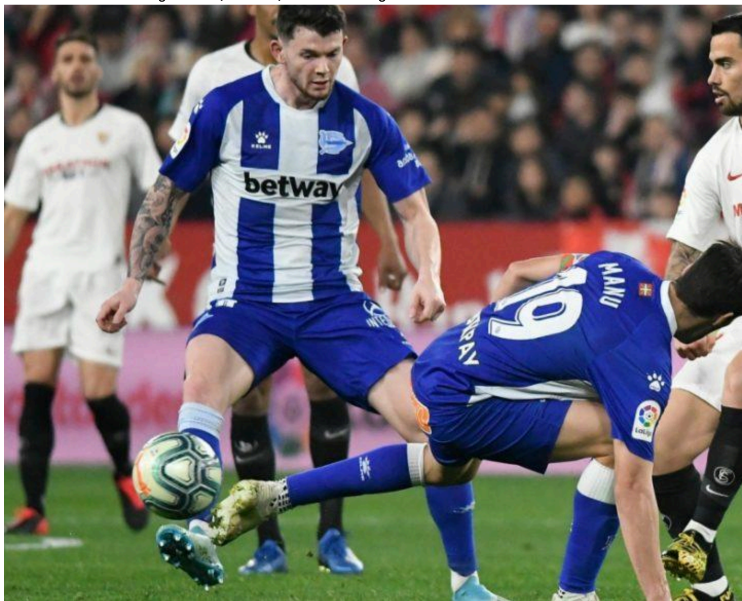
Kèo nhà cái Sevilla vs Alaves

Tuy nhiên Alaves cũng chưa bao giờ cho NHM cảm giác an tâm mỗi khi phải hành quân thi đấu xa nhà. Cụ thể trong 5 chuyến hành quân xa nhà gần đây nhất, đội bóng thành phố Vitoria-Gasteiz mới chỉ giành được vốn vẹn 1 chiến thắng.