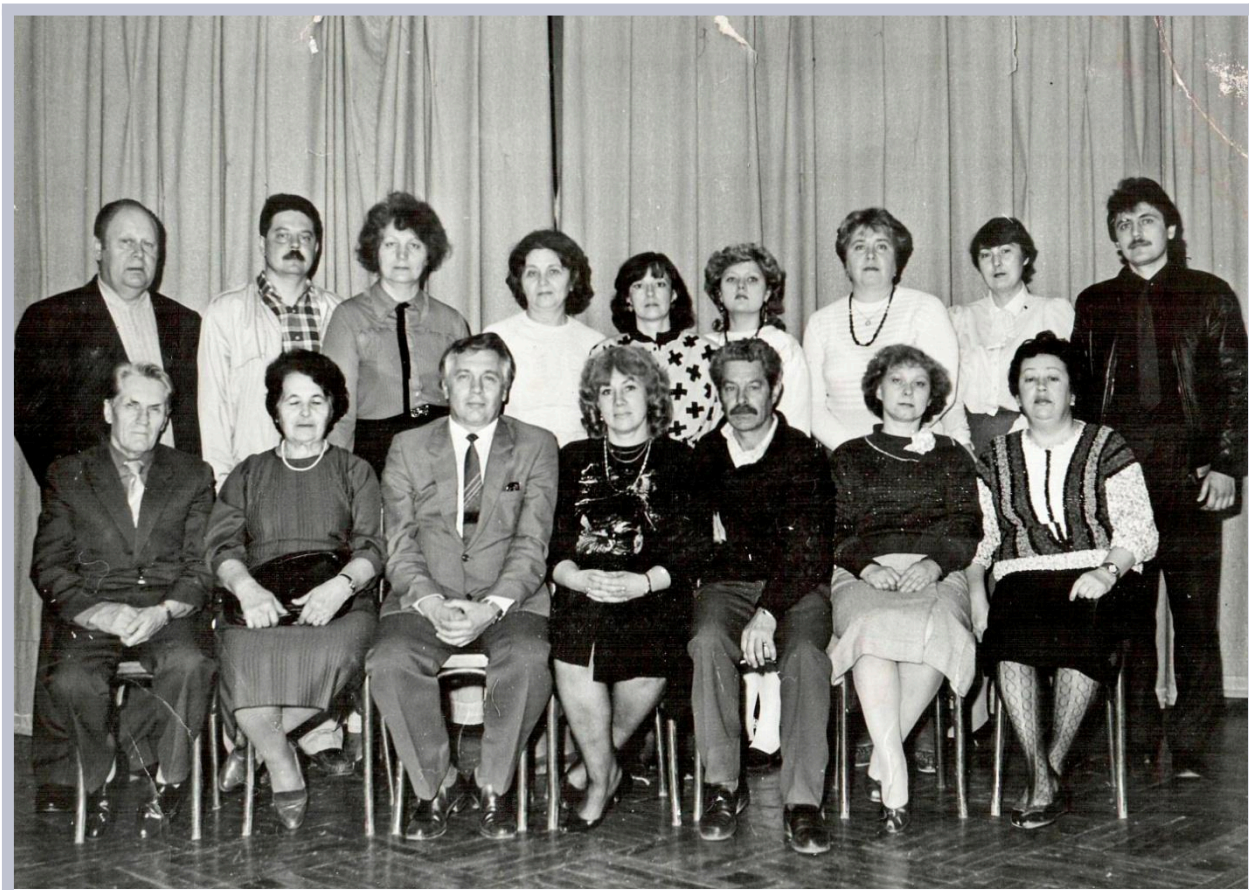
Склад кафедри ЕОПВ кінця 80-х років ХХ сторіччя