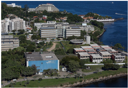
Figura 1. Título da figura {tamanho 11}