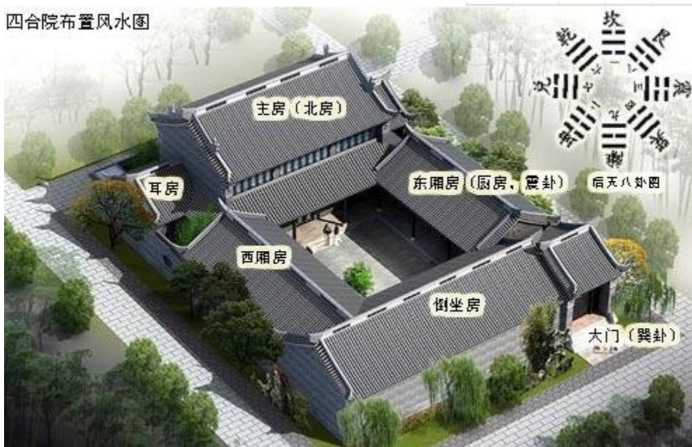
四合院布置风水图