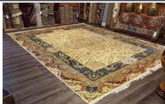
Ковром шелковым стелется,