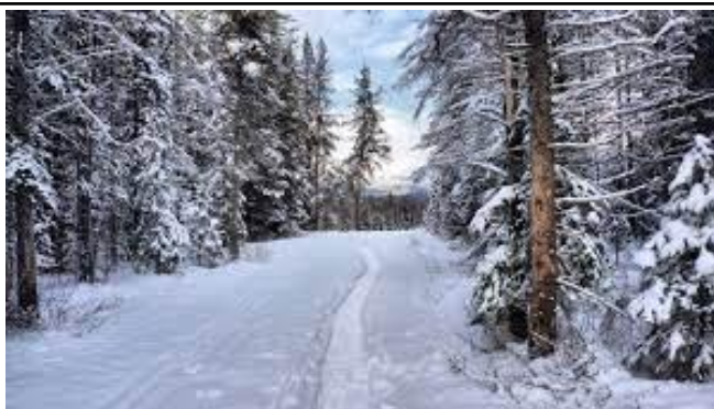
Поёт зима – аукает,