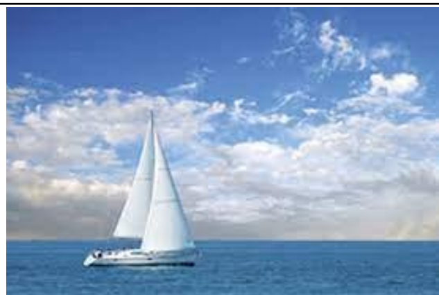
Плывут в страну далёкую