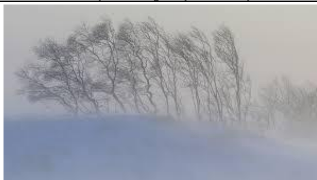
А по двору метелица