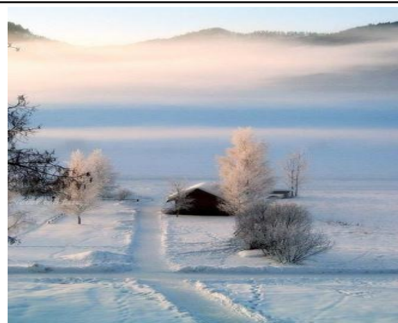
Кругом с тоской глубокою