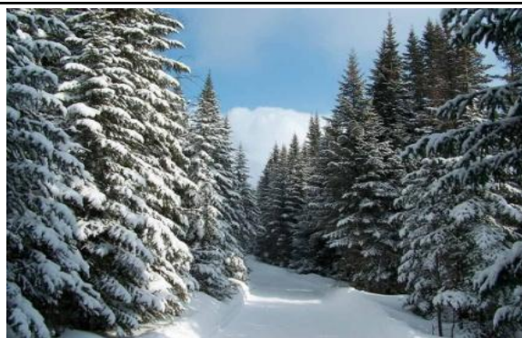
Мохнатый лес баюкает