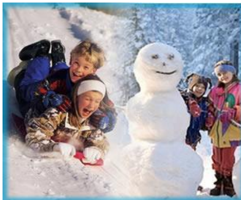
Crianças brincando em lugares de baixas temperaturas

O clima e o tempo são elementos naturais que interferem nos hábitos da população, como, por exemplo, nas roupas, visto que nas regiões frias as pessoas usam casaco, gorro, luva, cachecol, suéter, entre outros acessórios que possam combater a ação do frio. Já nas regiões com temperaturas mais elevadas, as pessoas se vestem com roupas mais leves.