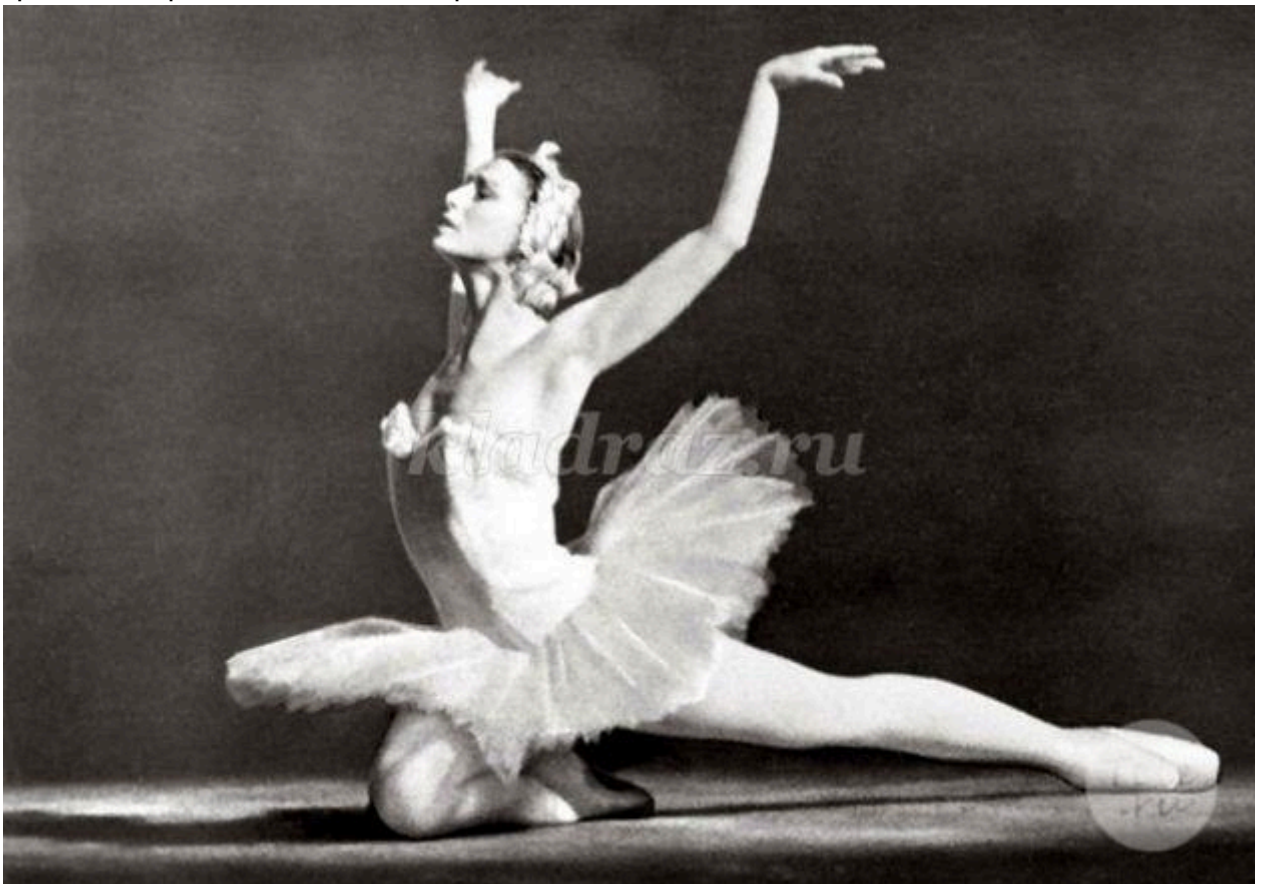
Герой Социалистического Труда, народная артистка СССР. Полный кавалер ордена «За заслуги перед Отечеством», лауреат премии Анны Павловой Парижской