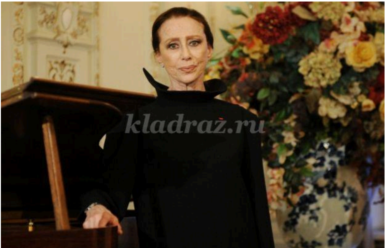
Артистка балета, представительница театральной династии Мессерер - Плисецких, прима-балерина Большого театра СССР в 1948-1990 годах.