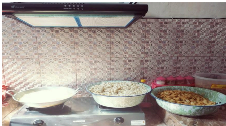
Gambar 1. Proses Pembuatan Keripik Lumpia