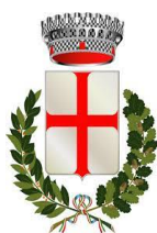
COMUNE DI CHIURO