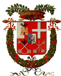
Provincia di Sondrio