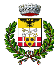
COMUNE DI TRESIVIO