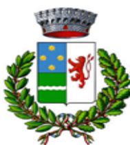
COMUNE DI PIATEDA