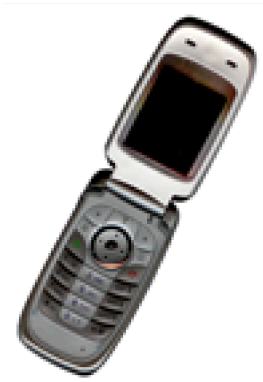
Gbr. 1 Contoh gambar dengan resolusi kurang

Semua hypertext link dan bagian bookmark akan dihapus. Jika paper perlu merujuk ke Internet alamat email atau URL di artikel, maka alamat atau URL lengkap harus ditulis dengan font biasa.