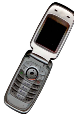
Gbr. 2 Contoh gambar dengan resolusi cukup