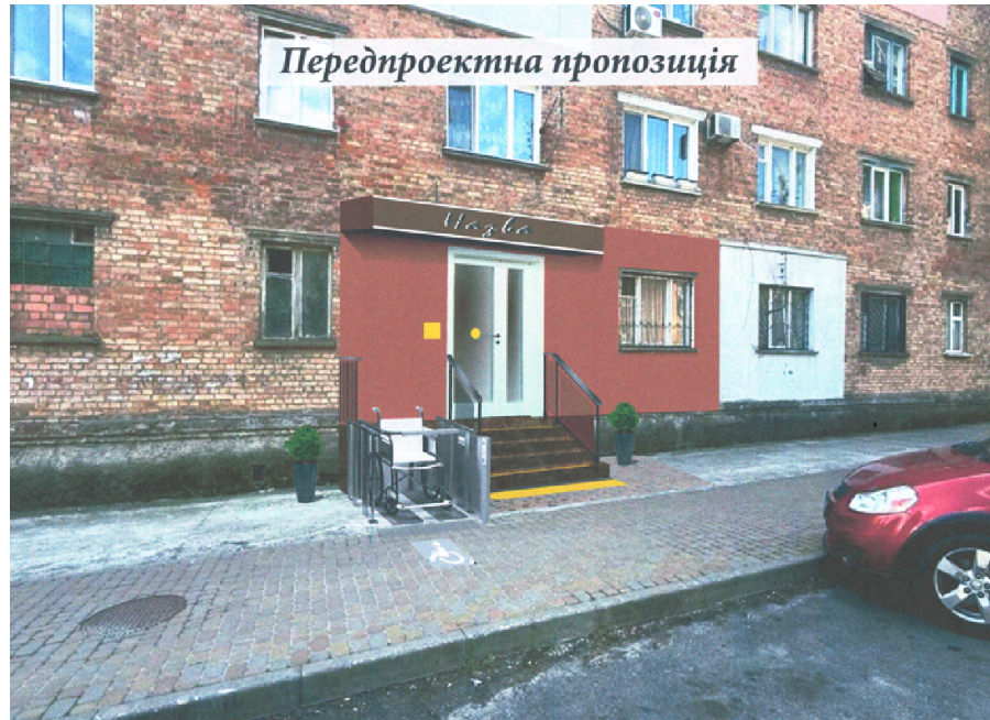
СХЕМА БЛАГОУСТРОЮ ПРИЛЕГЛОЇ ТЕРИТОРІЇ