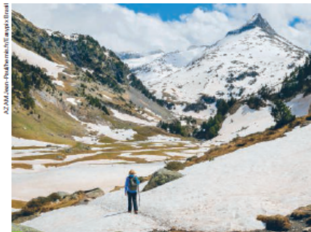
Figura 4. Pico do Aneto, na província de Huesca (Espanha), que faz parte dos Pireneus. Esse conjunto de montanhas fica na divisa entre a Espanha e a França. Fotografia de 2017.