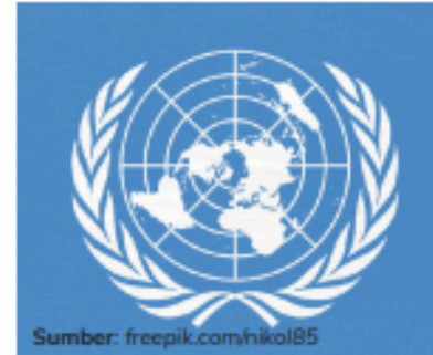
Gambar 4.3 Bendera lembaga internasional PBB.

Dalam perkembangannya, seluruh negara di dunia saat ini sedang menghadapi permasalahan global yang perlu diantisipasi secara bersama-sama. Permasalahan global adalah permasalahan yang berlangsung di hampir seluruh dunia, seperti persoalan ekonomi, polusi, perubahan iklim, dan lain sebagainya.