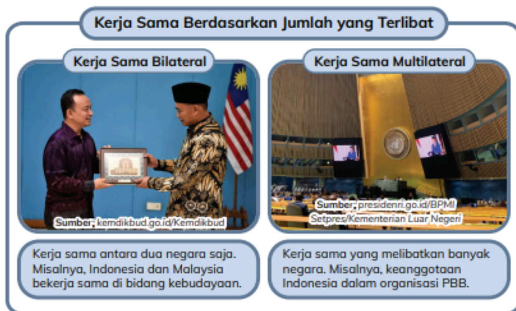
Gambar 4.5 Macam kerja sama antarnegara.

Jika dilihat dari kawasannya, jenis kerja sama terbagi menjadi kerja sama regional dan kerja sama internasional. Kerja sama regional adalah kerja sama negara-negara dalam satu kawasan (negara-negara yang wilayahnya berdekatan). Misalnya, ASEAN yang beranggotakan negara-negara di kawasan Asia Tenggara. Adapun kerja sama internasional adalah kerja sama antarnegara yang tidak dibatasi wilayah dan mencakup seluruh dunia.