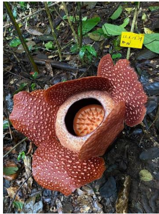
Gambar 2.1 Bunga Rafflesia arnoldii [1]

spacing before 12 pt. Nomor dan judul gambar diletakan di bawah gambar, rata tengah (center) terhadap batas margin. Judul gambar harus sama dengan judul gambar yang tercantum pada halaman Daftar Gambar. Setiap gambar diberi nomor. Nomor gambar terdiri atas dua angka Arab yang dipisahkan oleh sebuah titik. Angka pertama menunjukkan nomor bab tempat gambar tersebut dimuat, sedangkan angka kedua menunjukkan nomor urut gambar dalam bab yang sama. Judul gambar ditulis dengan huruf kecil, kecuali huruf pertama kata pertama dan kata/huruf yang harus ditulis dengan huruf kapital. Pencantuman sumber dilakukan jika gambar bukan merupakan hasil analisis. Gambar hasil analisis data tidak dicantumkan sumber. Gambar yang dibuat landscape, bagian bawah gambar harus mengarah ke luar laporan. Contoh format gambar sebagai berikut.