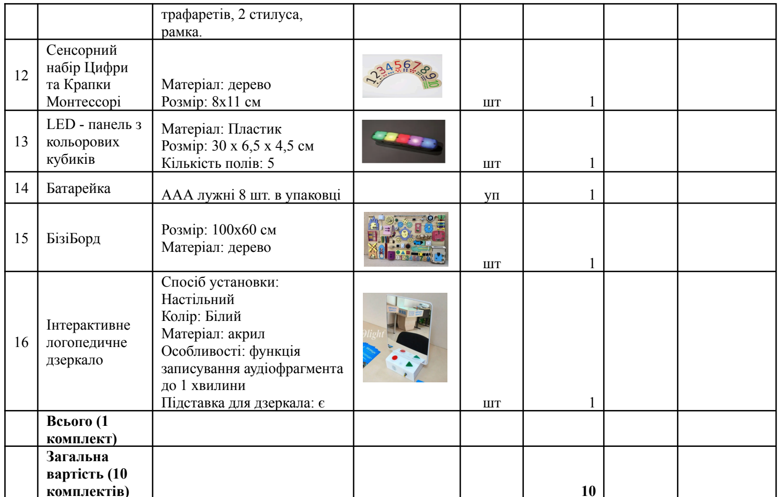
Фото наведені виключно з ілюстративною метою. Учасник може запропонувати еквівалентний товар. Запропонований товар не може бути нижчим за якістю та функціональними характеристиками, ніж наведений у прикладі.

Гарантія на товар — не менше 12 (дванадцяти) місяців з моменту поставки.