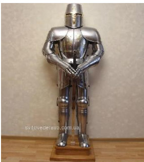
1- Лицарські обладунки. Доба Середньовіччя