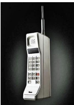
2- Перший мобільний телефон, XX ст.