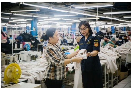
Foto yang dikirimkan berjudul " Forging Stronger Bonds: Indonesian Customs Empowering Industries for Growth "

Pemenang event ini pada tahun 2024 adalah negara Norway "Snow Mobile Patrol"