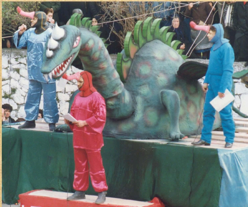
Οι εξωγήινοι (1988)