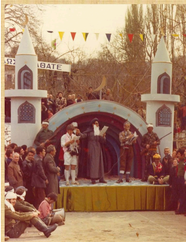
Χομεινί. Η δίκη του Σάχη (1980)