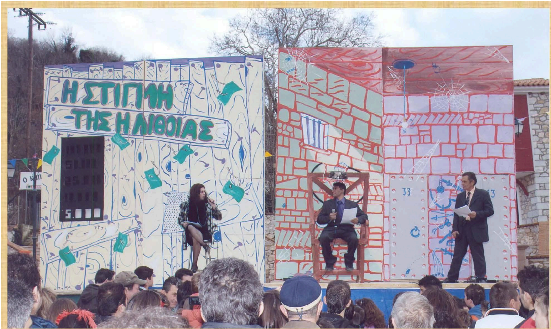
Η στιγμή της αλήθειας (2009)