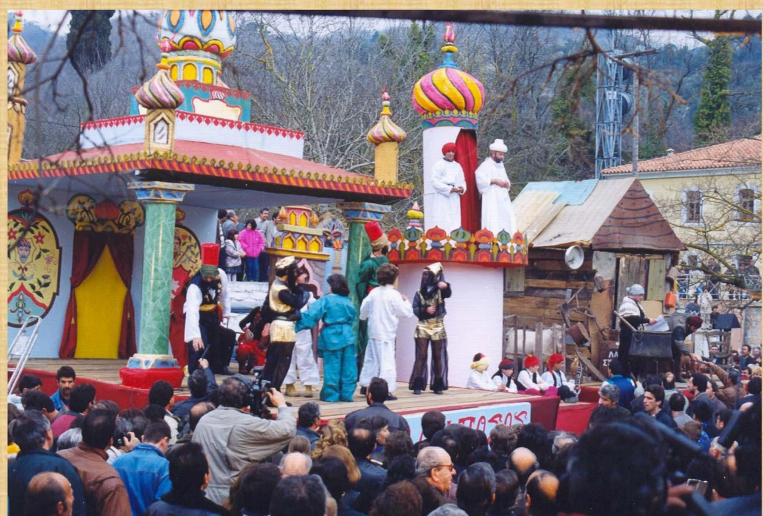
Αλή Πασάς (1998)