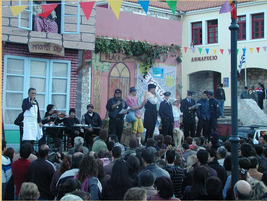
1 η Γιορτή Ινδικής Κάνναβης (2008)