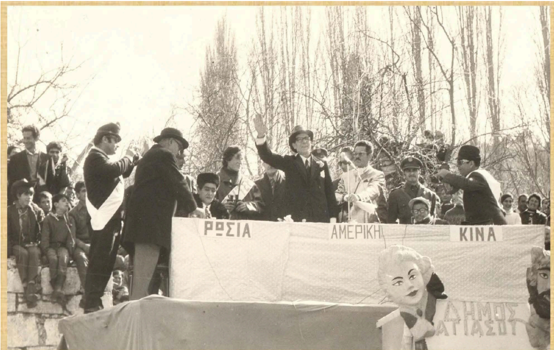
Συνάντηση Κορυφής (1973)