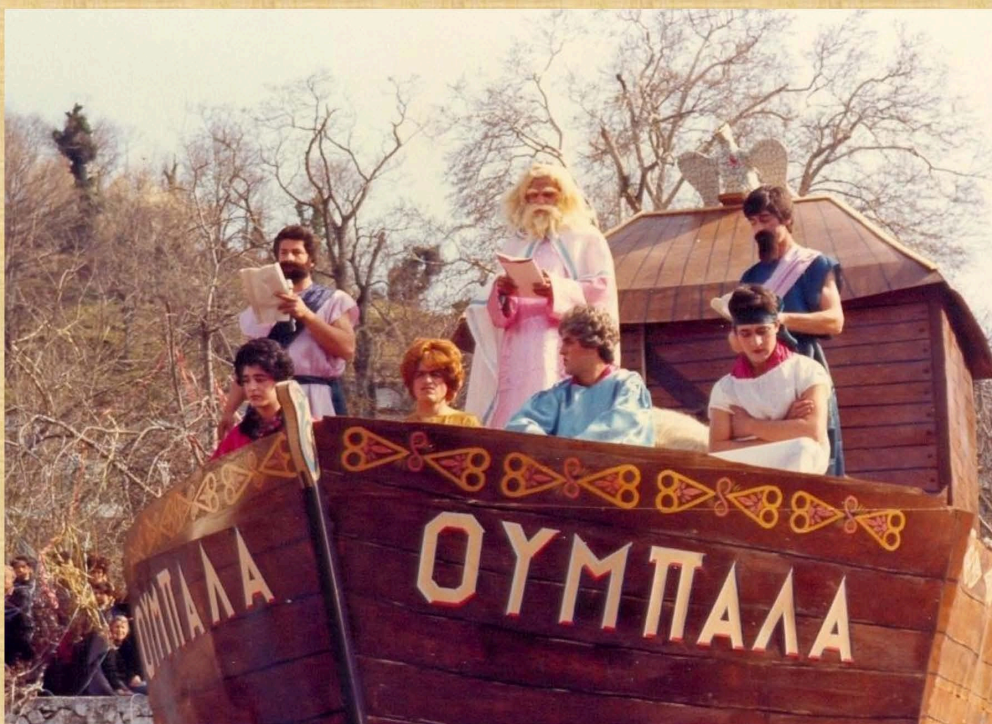
Η Κιβωτός του Νώε (1983)