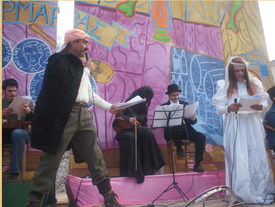
Ρεμπέτης μόνος ψάχνει... (2010)