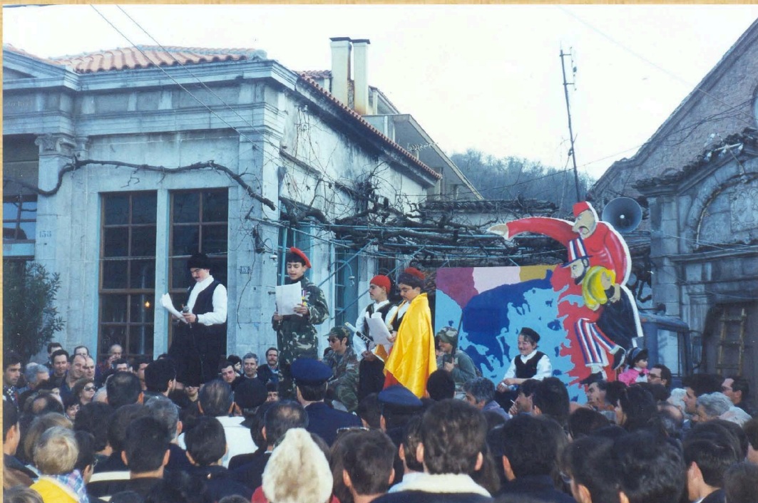
Ειρήνη στο Αιγαίο (1998)