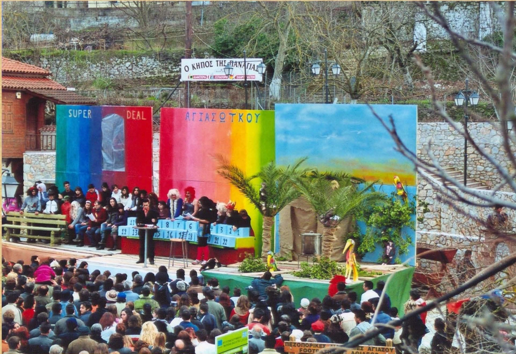
Αγιασώτ'κου Σούπερ Ντιλ (2007)