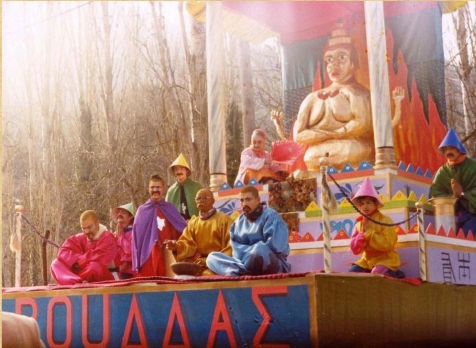
Ο Βούδας (1982)