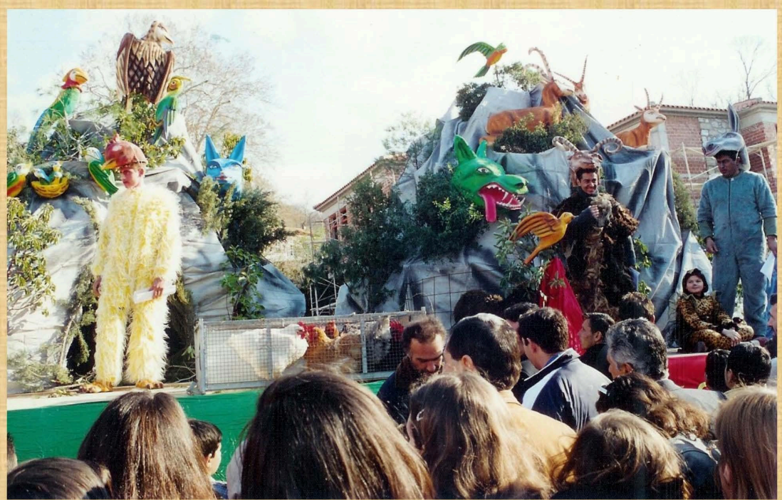
Ο κόσμος των ζώων (2002)