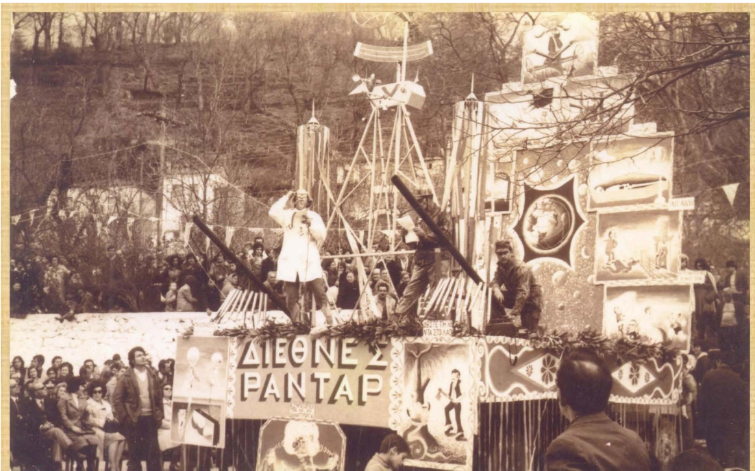
Διεθνές παντάρ (1975)