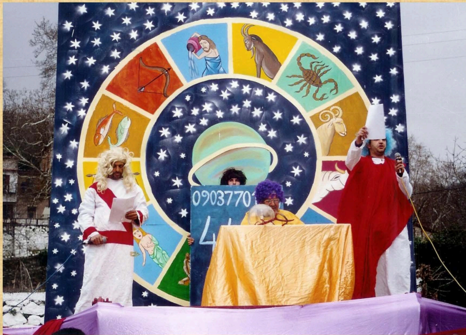
Αστρολογικό Ινστιτούτο (2001)