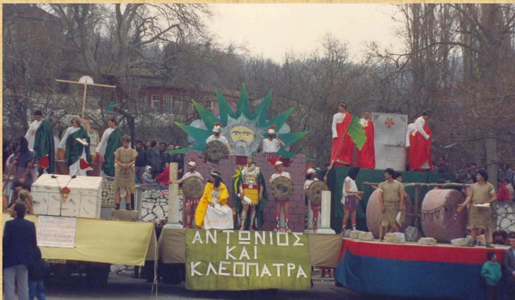
Αντώνιος και Κλεοπάτρα (1989)