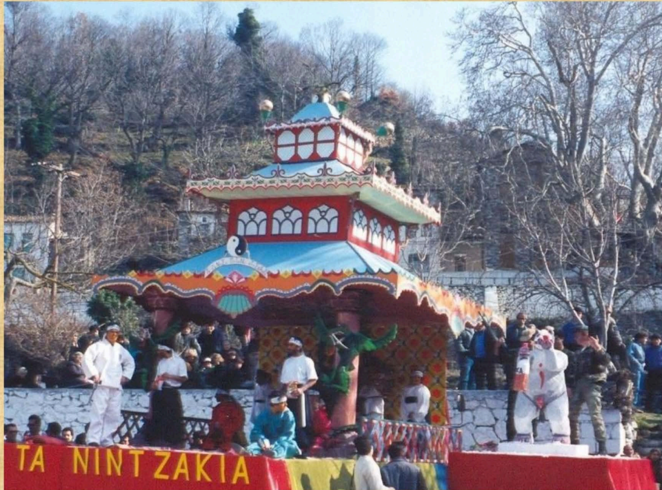
Τα Νιντζάκια (1992)