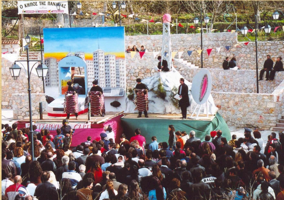
Μπούτσαφον αλά καρτ (2006)