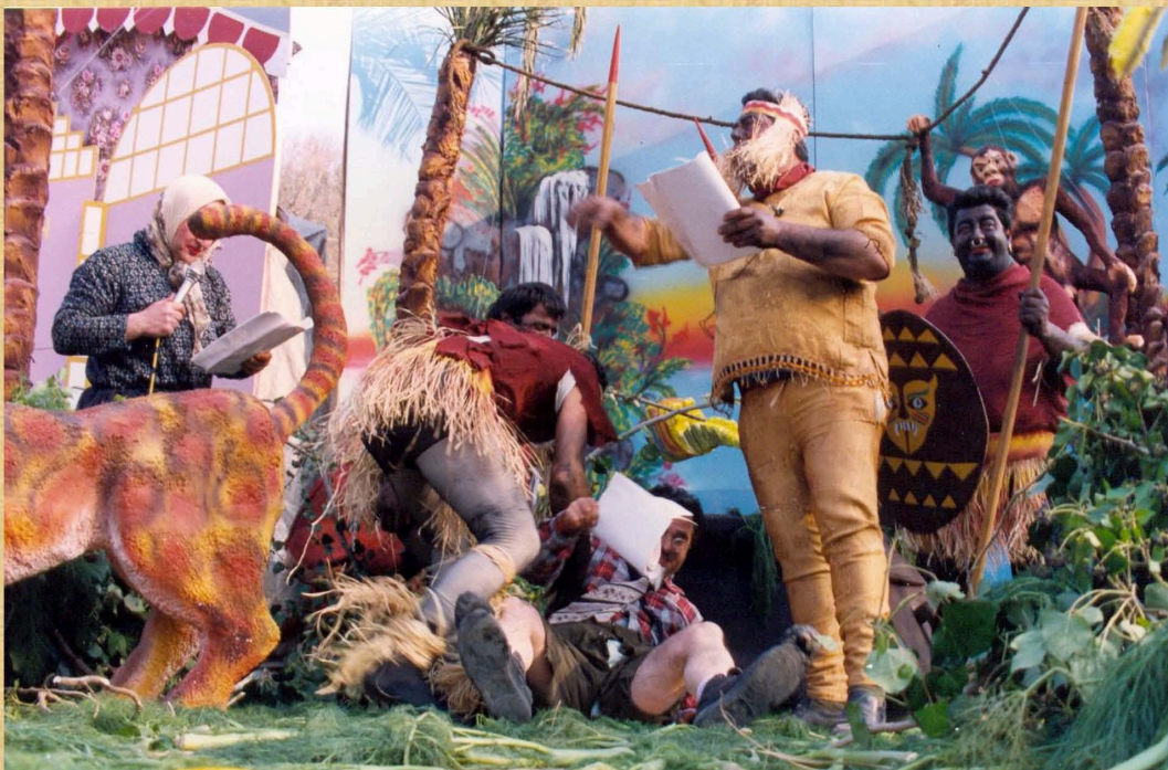
Ραντεβού στα σκουτ'νά (1992)