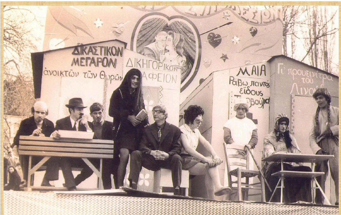
Γραφείο Συνοικεσίων (1973)