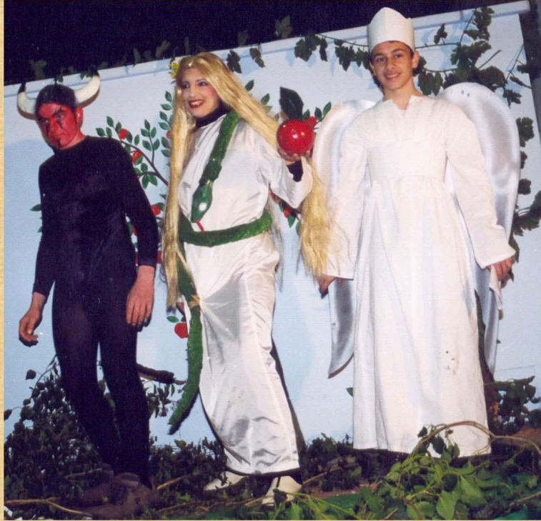
Μνημόσυνο παλιών καρνάβαλων (2001)