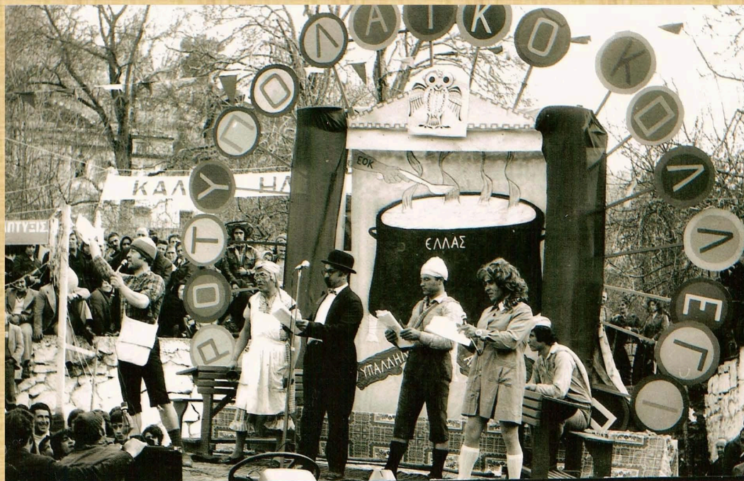
Λαϊκό Κολέγιο (1976)