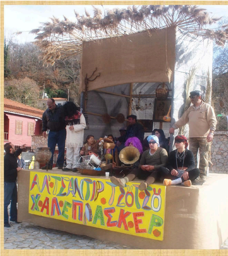
Αλ Τσαντίρ Τσουτσού Χαλέπ' Ασκέρ' (2010)