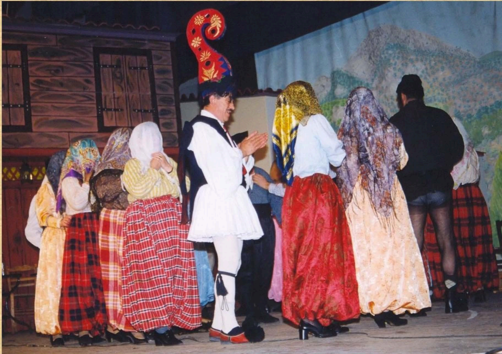
Παραδοσιακά τριψίματα (1999)