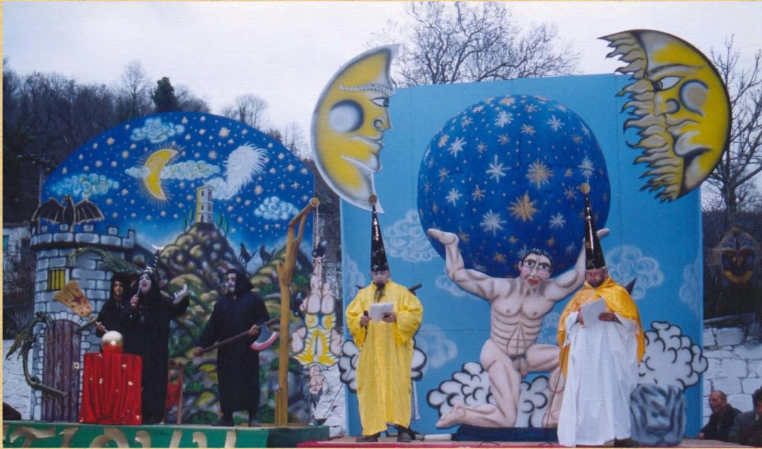
Μέντιουμ 090 (1998)