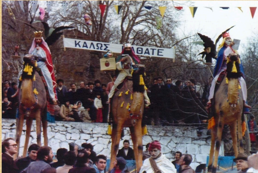
Οι τρεις Μάγοι με τα δώρα (1980)