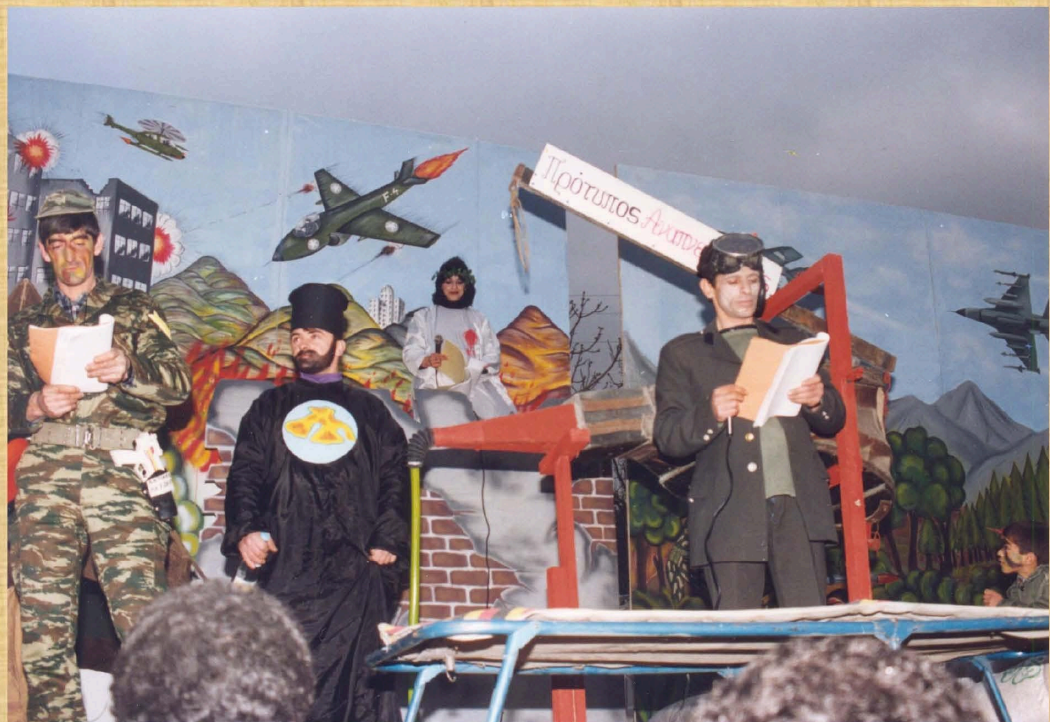
Ωνάσειο Στρατιωτικό Κέντρο (1996)