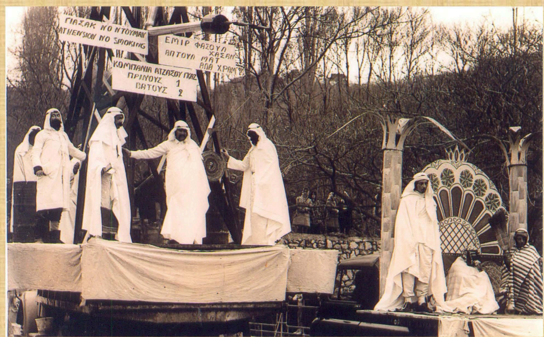
Αγιάσου Γκαζ: Πρίνουσ 1 - Βάτουσ 2 (1974)