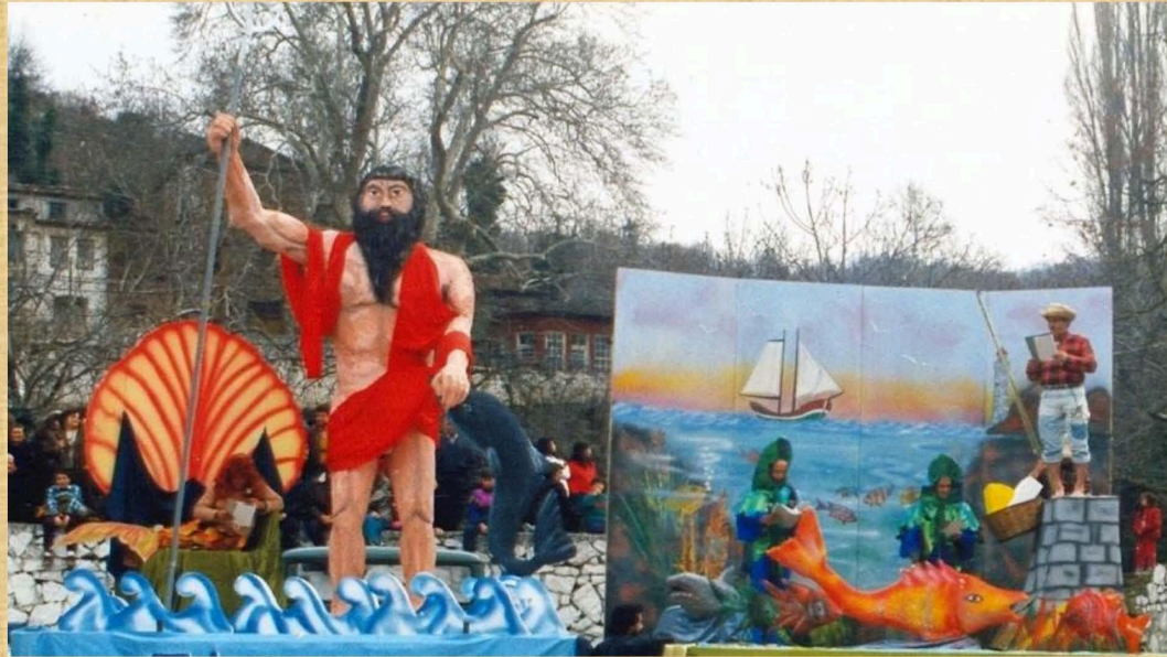
Τα Ψάρια (1993)