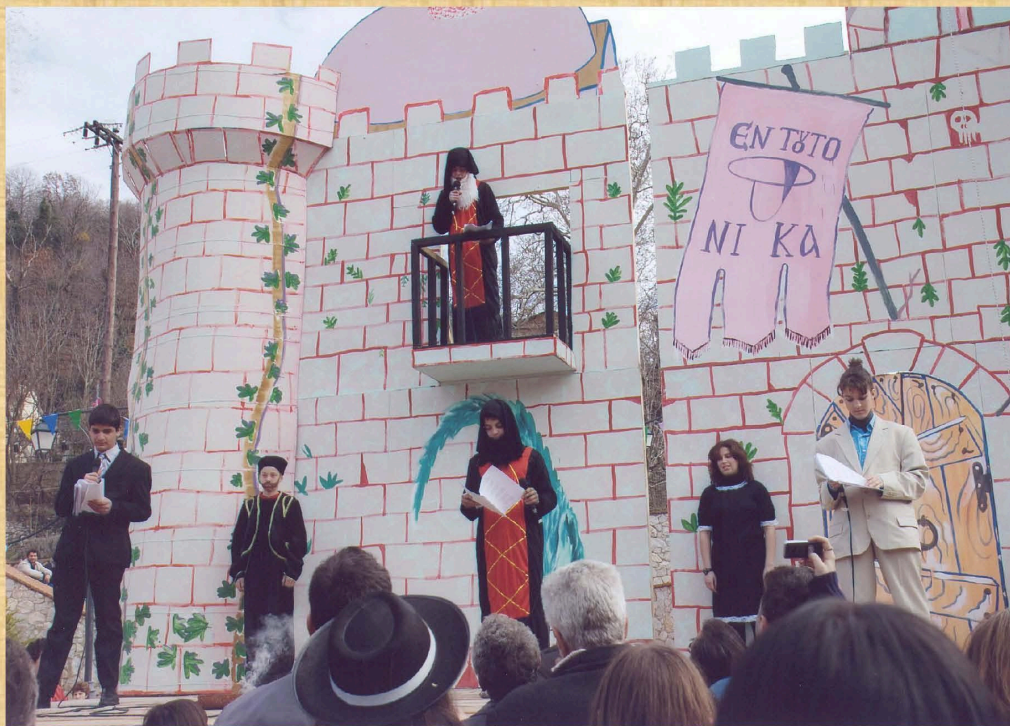
Μο(υ)νή Κακναβάτου (2009)