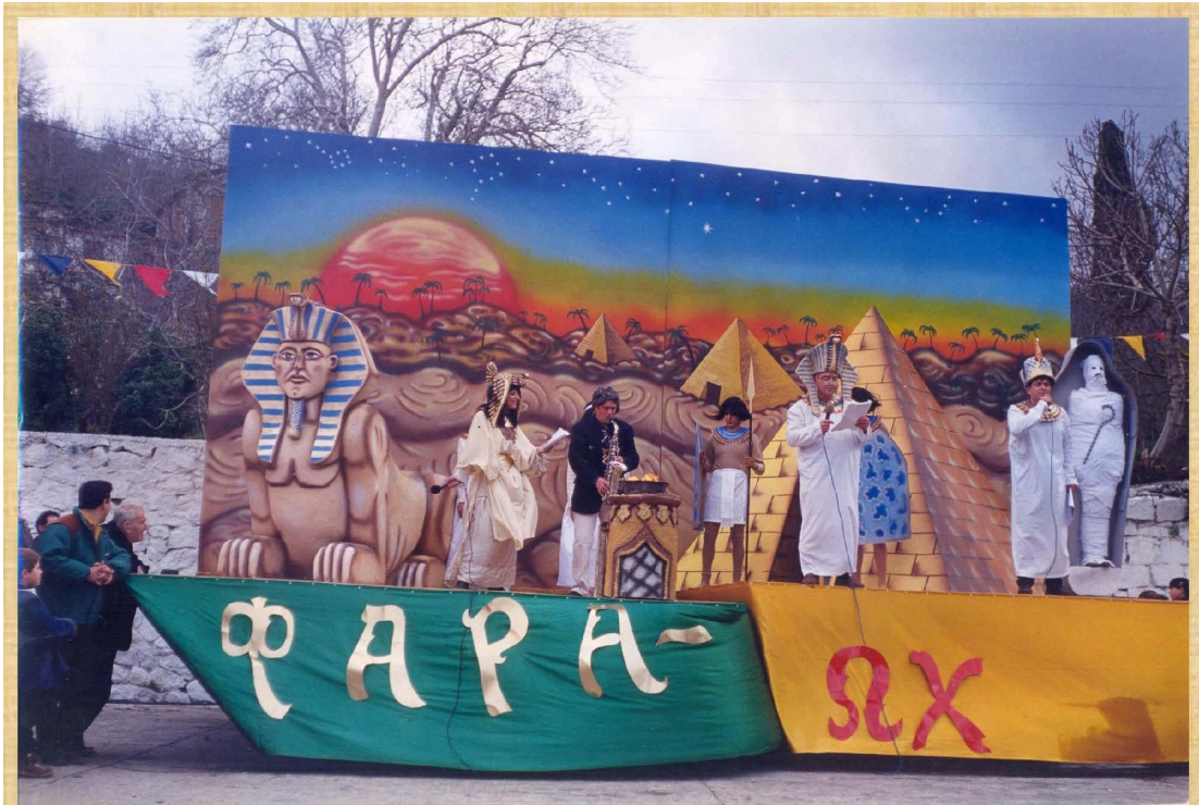
Σφίγγα Φαρα-ώχ (1999)