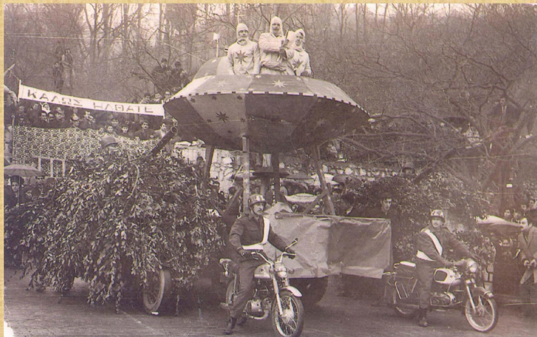
Ιπτάμενος Δίσκος (1971)