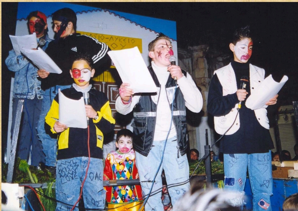
Μαθητικές καταλήψεις (1999)