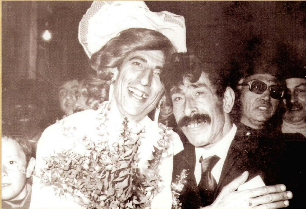
Ο γάμος (1978)