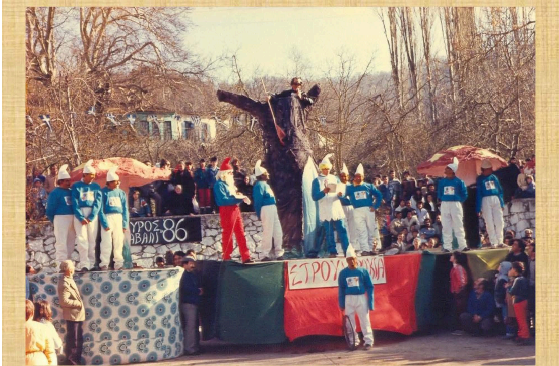
Τα στρουμφάκια (1986)