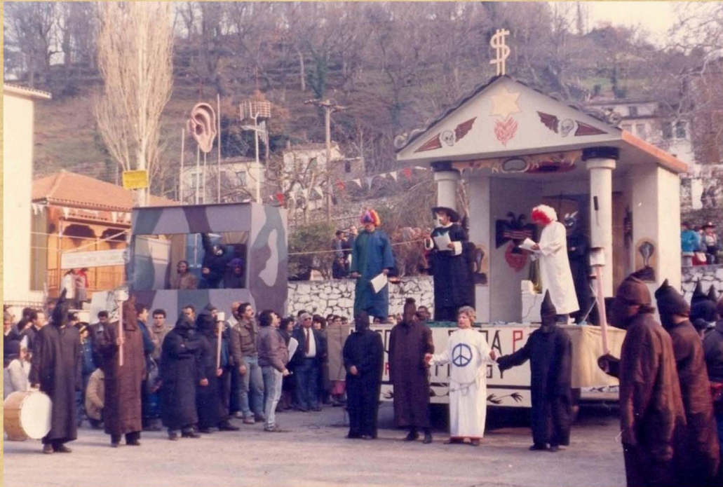
Μασουνική Στουά Πι-Τριγιά (1988)