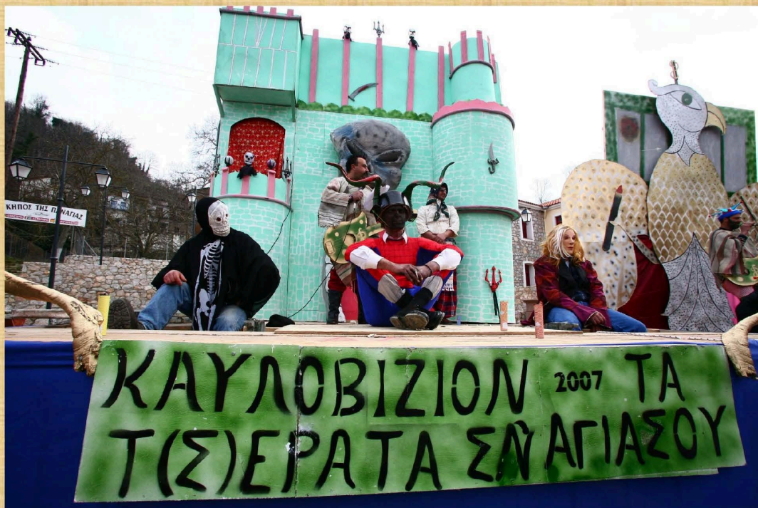
Καυλοβυζιόν - Τα τ(σ)έρατα στην Αγιάσο (2007)