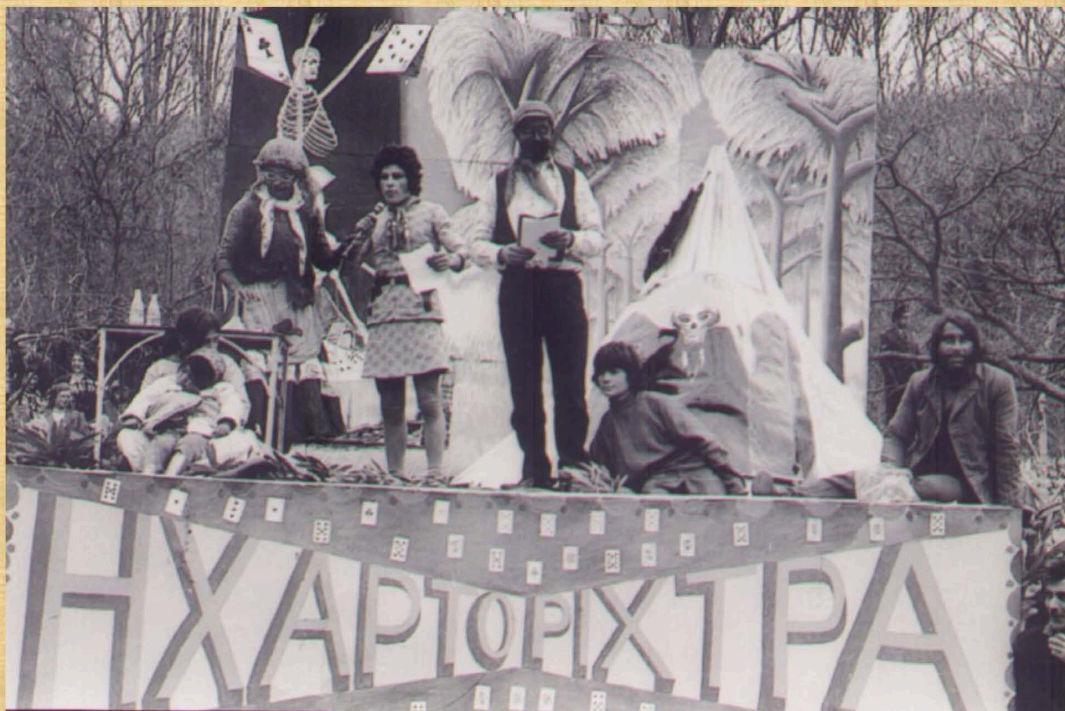
Η χαρτορίχτρα (1974)