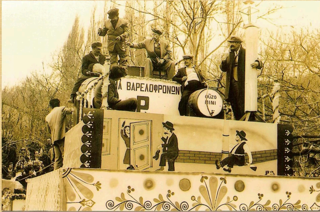
Κόμμα Βαρελοφρόνων (1974)