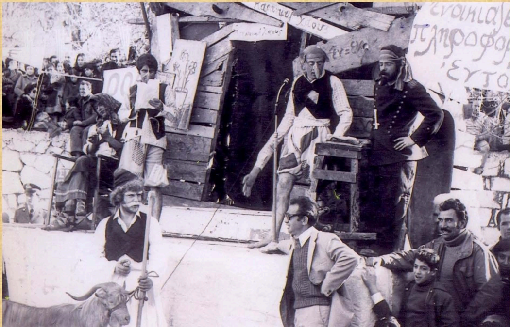
Ο Καραγκιόζης γανωτής (1977)