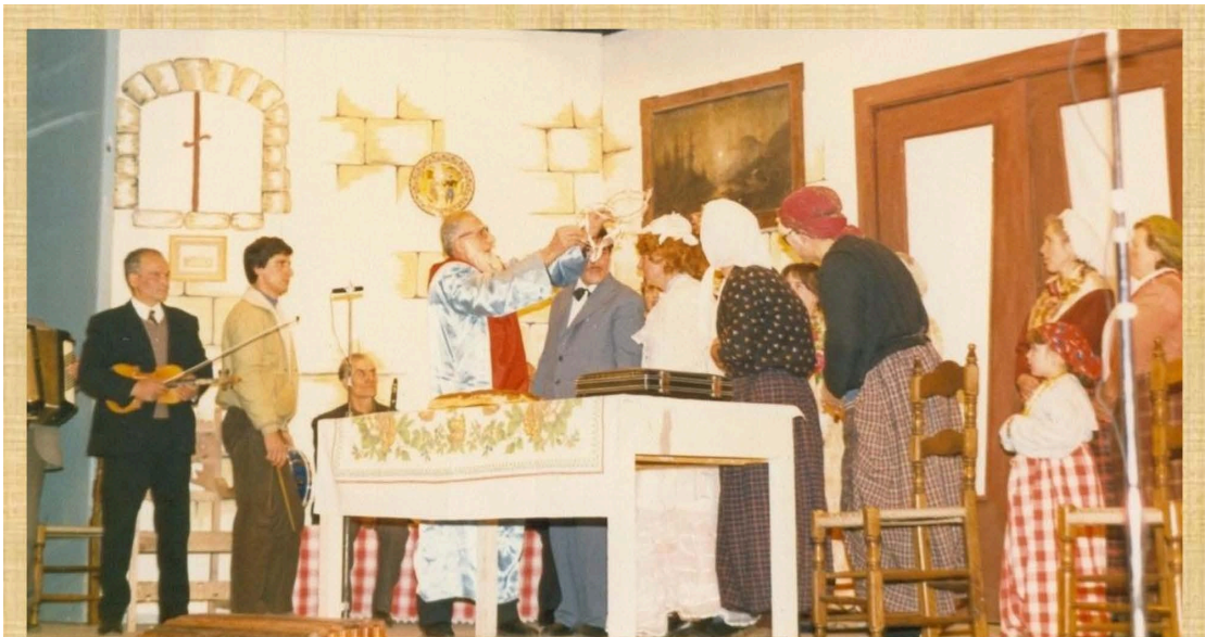
Ο Γάμος (1987)