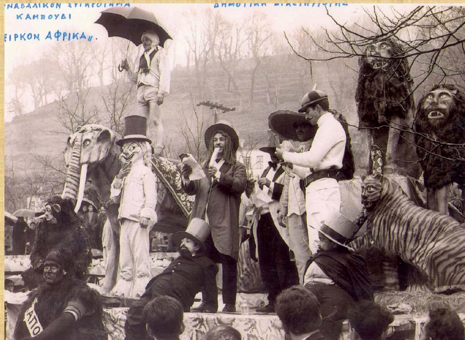
Τσίρκο Άφρিকা (1971)