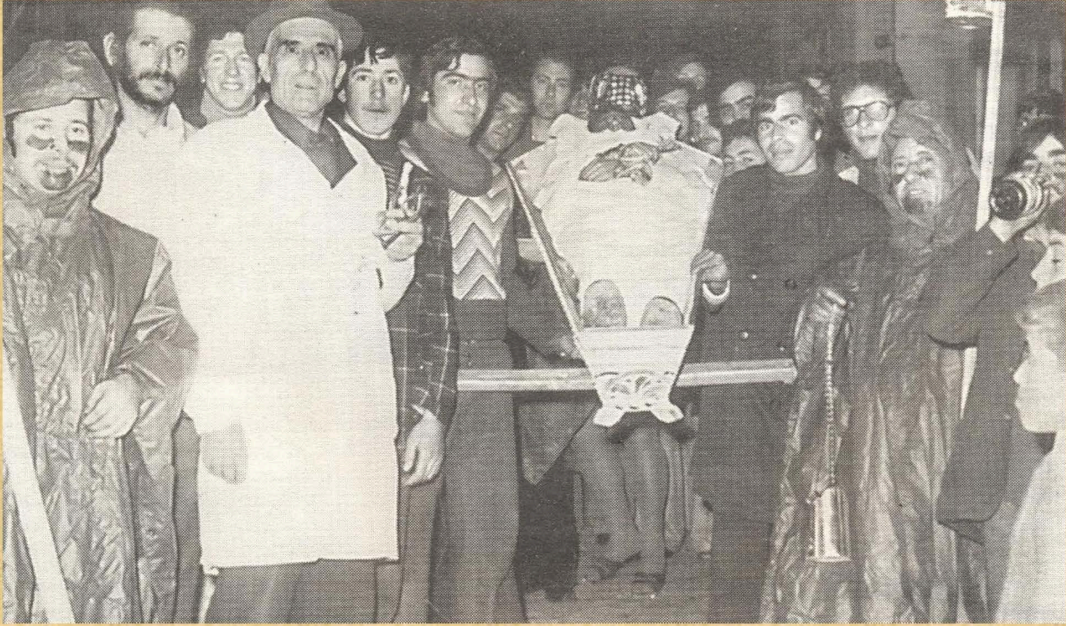
Η κηδεία (1977)