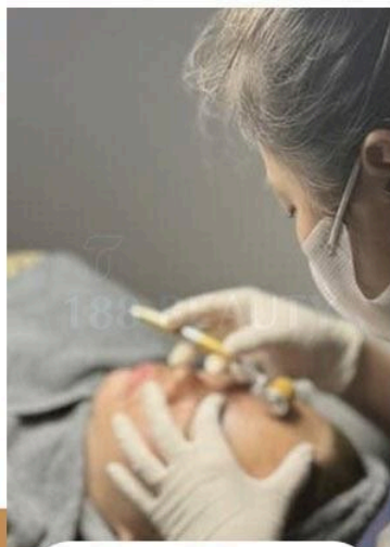
Giảm bít tắc, gom nhân mụn giảm thâm