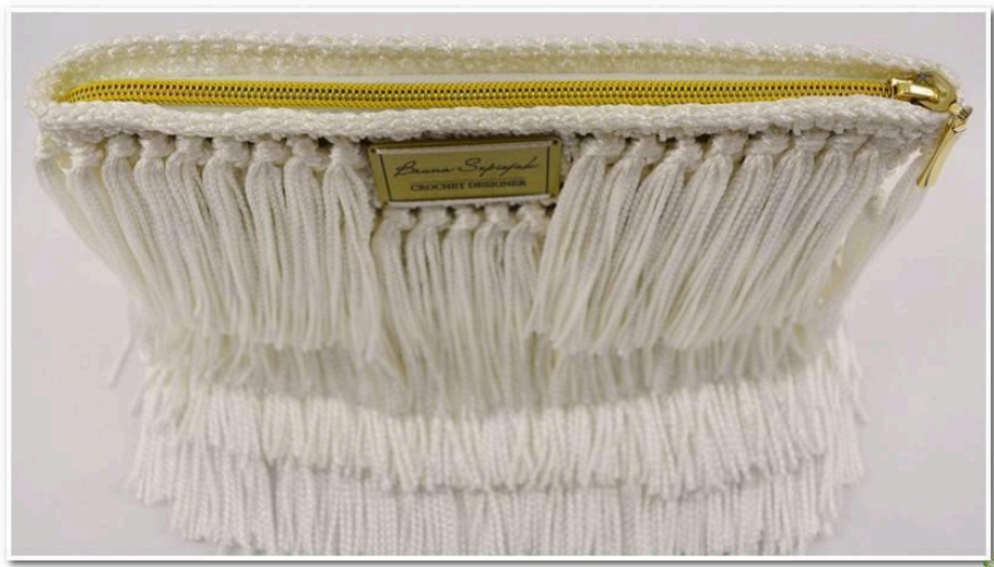
Модель 3. Вязаная косметичка.